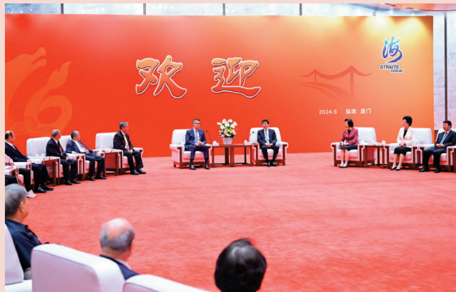
▲6月15日，第十六屆海峽論壇大會暨致辭。王滬寧會見參加論壇的台灣嘉賓代表。