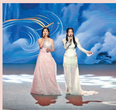
▲台灣歌手陳妍希（左）與大陸歌手張含韻在海峽論壇大會上共唱歌曲《若思念便思念》。