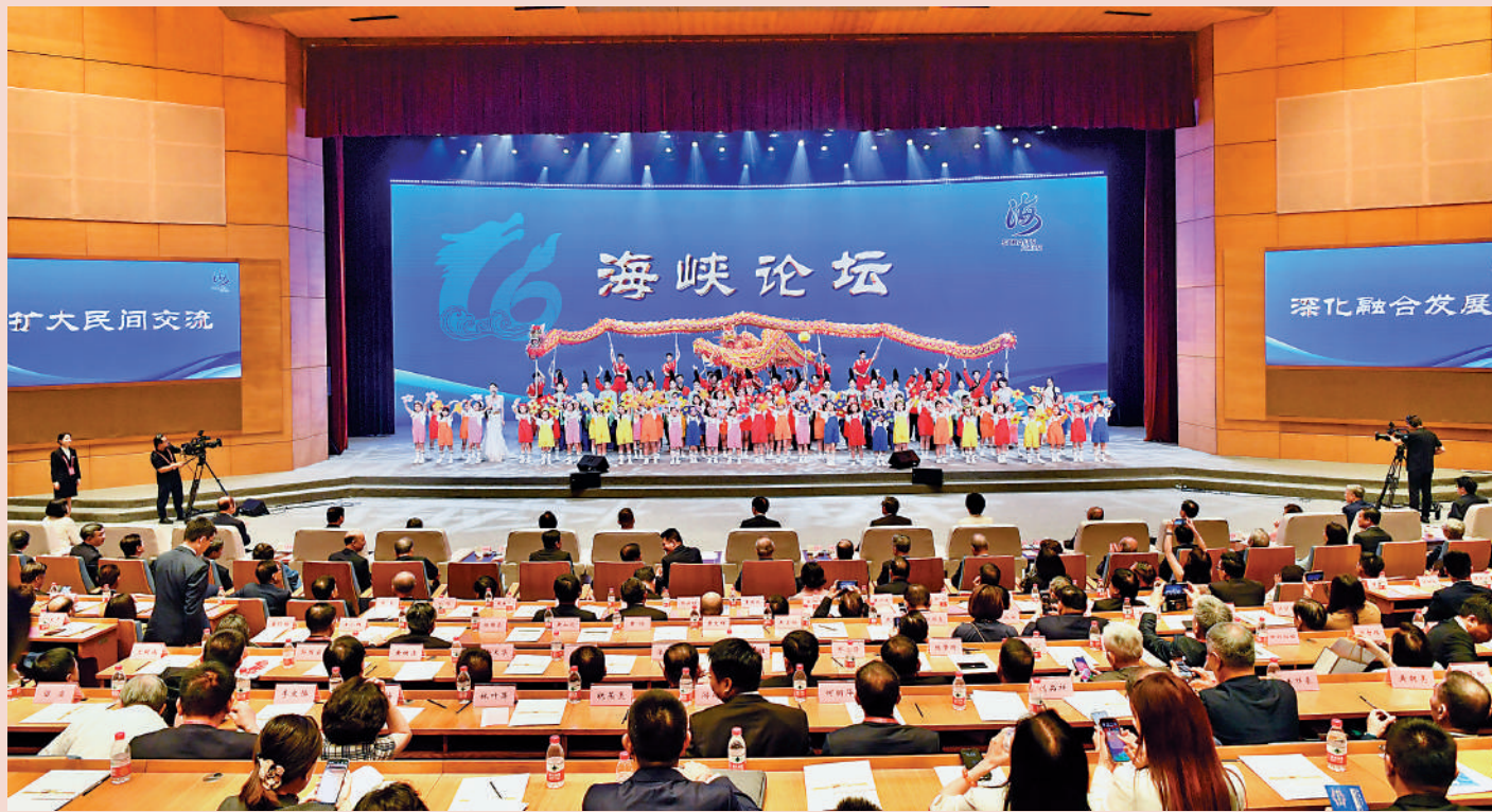
▲6月15日，第十六屆海峽論壇大會暨致辭。王滬寧出席並致辭。

第十六屆海峽論壇大會6月15日在廈門舉行。中共中央政治局常委、全國政協主席王滬寧出席並致辭。王滬寧強調，兩岸同胞要本着對歷史、對民族負責的態度，堅決反對「台獨」分裂和外來干涉，堅定守護中華民族共同家園，共同維護台海和平安寧，共同推動兩岸關係重回正確道路。國家統一是一是中華民族走向偉大復興的歷史必然。我們有堅定的意志、充分的信心、強大的能力粉碎任何「台獨」分裂圖謀。我們始終尊重、關愛、造福台灣同胞，持續增進台灣同胞利益福祉，歡迎更多台灣同胞參與到兩岸交流合作、融合發展中來，參與到民族復興進程中來，分享中國式現代化發展機遇，共享中華民族發展壯大的偉大榮光。