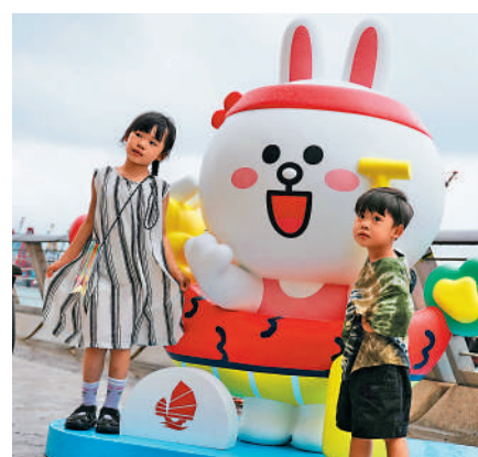
▲星光大道在比賽期間首設美食街及打卡熱點，吸引大批市民拍照。

廣州旅客鄧先生認為，龍舟競渡非常有趣，可惜天公不造美，但認為雨勢尚可接受，不算影響體驗。有旅