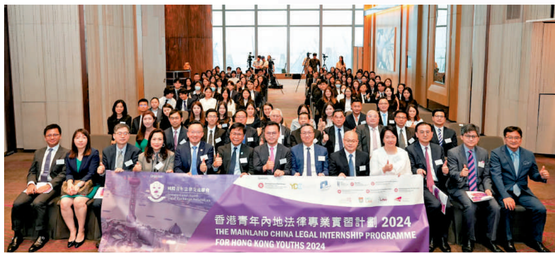
▲律政司司長林定國昨日出席「香港青年內地法律專業實習計劃2024」啟動禮，與嘉賓及學員們合照。

「如要形容這個計劃，用『王牌』這個字我也不反對，因為我有調研過，今時今日似乎類似的活動在規模上或內容豐富方面，如果它認第二，應該也沒有人敢認第一。」林定國說，香港是一個很小的地方，但我們的機會真的不限於香港。香港作為世界唯一中英雙語的普通話地區，以及中國唯一的普通話地區，年輕人應該思考如何發揮優勢，助力香港及國家發展。他還表示，相信同學過去可能都是從書