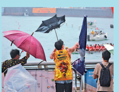
▲昨日雖然天公不造美，整日風雨交加，但大批市民與旅客仍冒雨觀賞龍舟賽。中通社