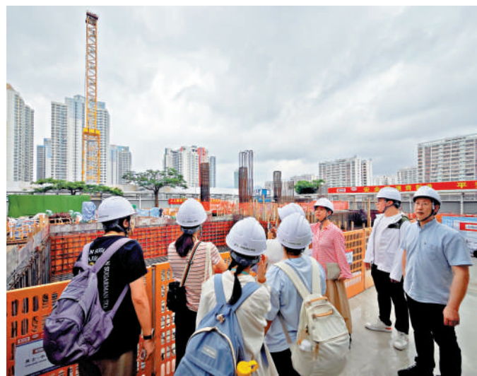
▲何永賢聯同區議員及一批劊房戶，參觀彩興路項目樣板單位，並鼓勵有需要人士把握機會申請。

何永賢說，取締不適切居所一定要按部就班，不能太急，「當我們的傳統公屋、過渡性房屋及簡約公屋有五萬個單位在手，就能籌謀」，而且可以分批、分優次取締，強調不會有人因而流離失所。她說不合規格的劊房可以糾正，例如重新裝配獨立水錶及電錶，可設立登記期及寬限期。她並說，現時的劊房租金不合理，面積約8至10平方米的房間，月租高達7000元，「相信當有更好選擇，根本就不會有人要這些產品（劊房）」。