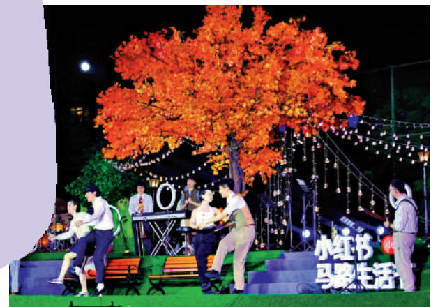
▲去年舉辦的小紅書首屆「馬路生活節」吸引超20萬人參加線下活動。

唐志敏說，芯片產業鏈非常長，上下游需要緊密的合作，政府可為企業創造更多合作機會。芯片有強大的產業生態環境需求，尤其在計算領域，目前是國外主導生態環境。在此背景下，政府部門如何把國內相關企業團結起來，打造適合於中國國產芯片發展的良好生態系統，非常重要。如何拉動芯片設計應用等源頭發力，帶動整個芯片製造業發展是關鍵。把芯片設計內需放大，整個中國芯片業才能更好地製造出芯片為自己所用。