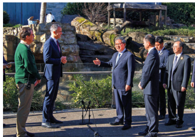
▲當地時間6月16日上午，正在澳洲訪問的國務院總理李強到阿德萊德動物園考察中澳大熊貓保護合作研究工作。