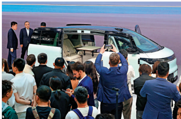
▲2024北京車展期間，基於浩瀚M架構打造的首款家庭出行產品極氪MX9首發亮相。