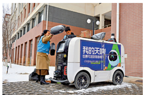
▲甘肅蘭州現代職業學院菜鳥驛站內，工作人員使用無人車進行快遞配送。

【大公報訊】記者韓毅重慶報道：6月16日，在「2024中國（重慶）獨角獸企業大會」上，長城戰略諮詢發布《中國獨角獸企業研究報告2024》，揭示中國獨角獸企業發展的最新格局。報告顯示，19家獨角獸企業在2023年上市，近七成選擇港交所。