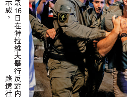
▲以色列民眾16日在特拉維夫舉行反對內塔尼亞胡的示威。

目前尚不清楚爆炸發生的具體原因。以國防軍發言人哈加里當日說，不排除是被反坦克導彈擊中這一可能。