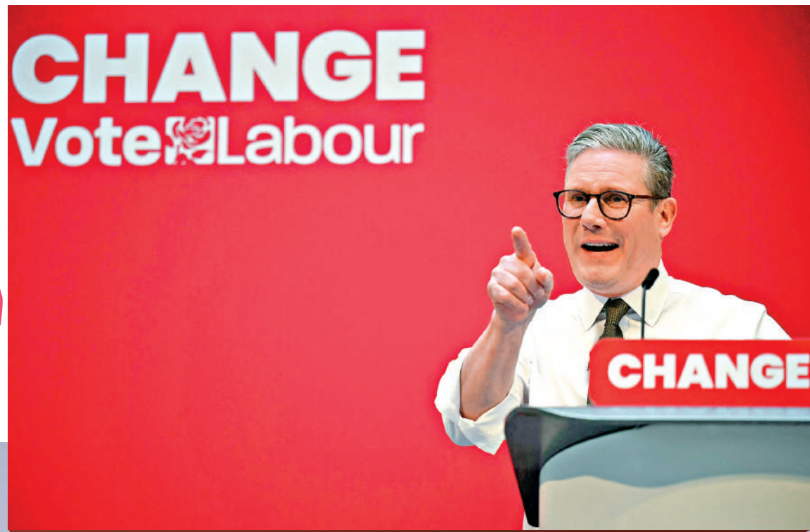
▲斯塔默領導的工黨有望成為執政黨。