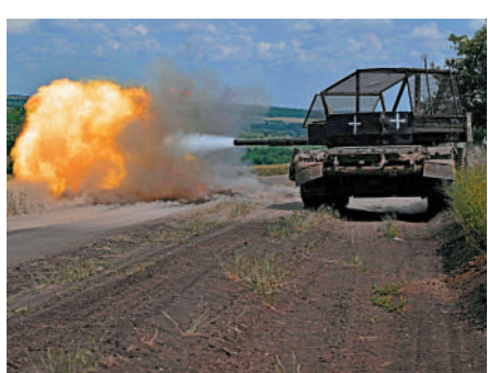
▲烏克蘭士兵9日在頓涅茨克演習開火。

據報道，峰會的工作小組也商討了全球糧食安全和核安全議題。公報指出，「糧食安全絕不能以任何形式遭到武器化」，並強調進入黑海和亞速海港口對於全球糧食供應「至關重要」。各國更呼籲將烏克蘭扎波羅熱核電廠的控制權交還基輔當局。