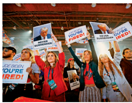
▲特朗普支持者15日在底特律參加競選活動。

告休息時間。在此期間，競選團隊的工作人員不能與候選人互動。特朗普和拜登在2020年的最後一場辯論充滿緊張氣氛，由於特朗普一再打斷拜登發言，拜登一度厲聲喝道：「你能閉嘴嗎，夥計？」