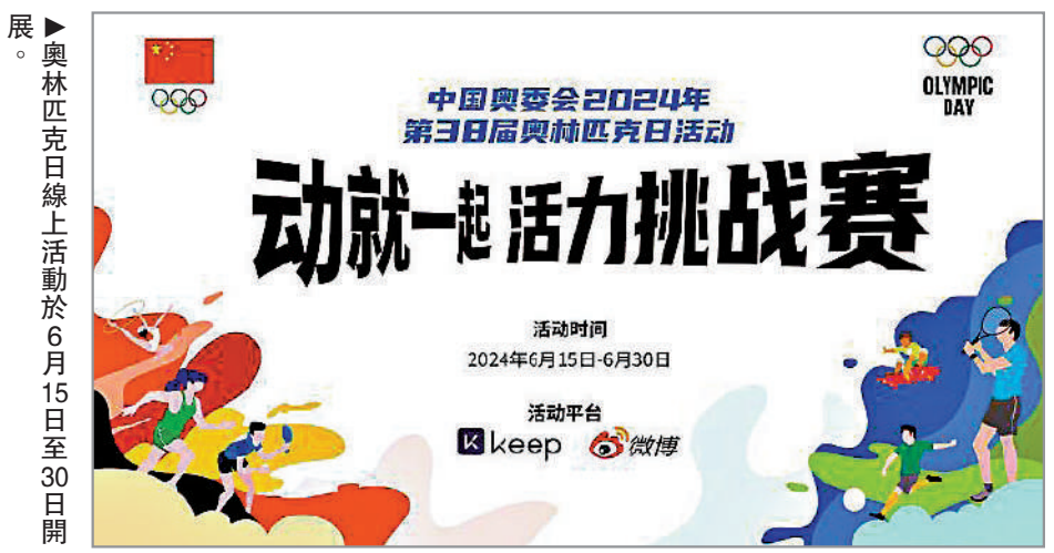
展。奧林匹克日線上活動於6月15日至30日開展。

奧林匹克日由國際奧委會於1948年設立，旨在紀念現代奧林匹克運動會的誕生，鼓勵全人類積極參與體育運動。自1987年以來，中國奧委會積極響應國際奧委會號召，已連續37年開展不同形式的活動，以此作為弘揚奧林匹克精神、傳播奧林匹克理念、推廣奧林匹克文化的重要平台。