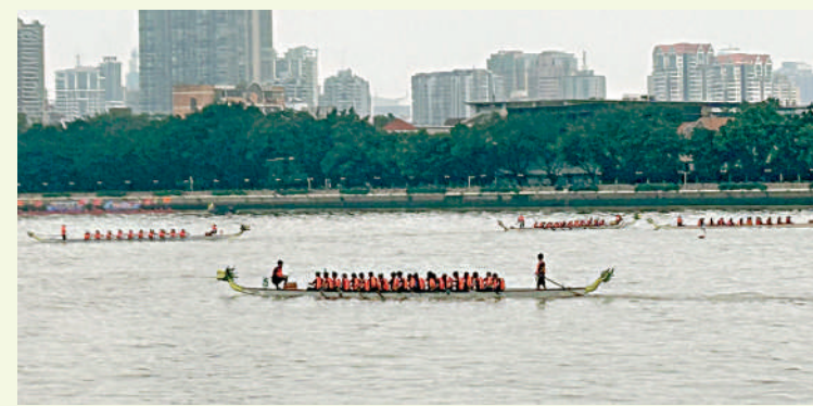
廣州國際龍舟賽。