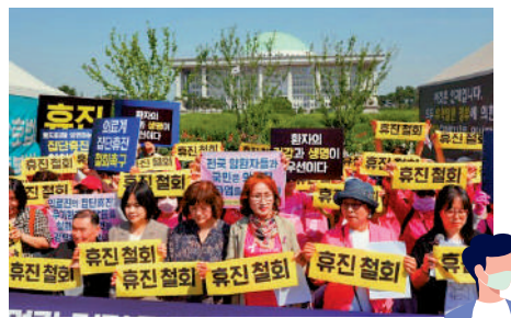
▲韓國患者團體13日在首爾示威，敦促醫療界停止罷工。

韓國總統尹錫悅今年2月初公布醫學院學生擴招計劃，擬從2025年起將醫學生年度招生名額增加2000個，從3058人增至5058人。此舉引發醫療界強烈抗議，上萬名實習醫生和住院醫生陸續辭職離崗，上萬名醫學生提出休學申請。韓國國會選舉之後，尹錫悅政府5月24日批准了各家醫學院提出的2025年擴招