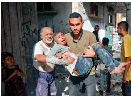
▲內塔尼亞胡敦促以軍繼續攻打加沙。圖為加沙兒童16日在以軍襲擊中受傷。

內塔尼亞胡16日晚在安全內閣會議上宣布戰時內閣正式解散。據以色列媒體報道，此後內塔尼亞胡、國防部長加蘭特將與其他相關官員就作戰問題進行小規模臨時磋商並做出關鍵決定，再交由安全內閣進行最終批准。戰時內閣成立於去年10月，核心成員包括內塔