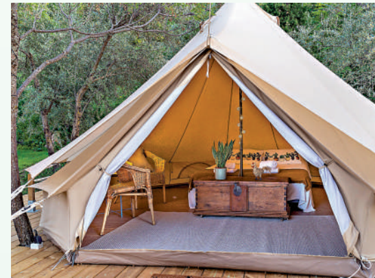
▲消委會發現七個提供「豪華露營」服務的場地當中，只有三個購買了第三者責任保險。

【大公報訊】本港的私營露營場地近年如雨後春筍湧現，消委會調查了22個私人露營場地資料，發現僅一成持有賓館（度假營）牌照或會社合格證明書，另有約四成場地懷疑違例發展；部分場地沒有購買第三者責任保險，甚至有場地要求消費者簽署免責聲明，列明無權追究責任。