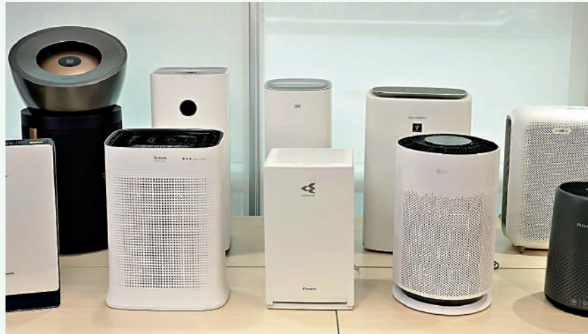
▲消委會測試10款空氣清新機，發現淨化空氣的效能參差。

衛生署稱，市面上有一些空氣清新機同時有加濕功能，免疫力弱的人士使用時應注入無菌水或煮沸後剛冷卻的食水，並按照製造商的指示定期清洗及保養，以減低患上退伍軍人症的風險。