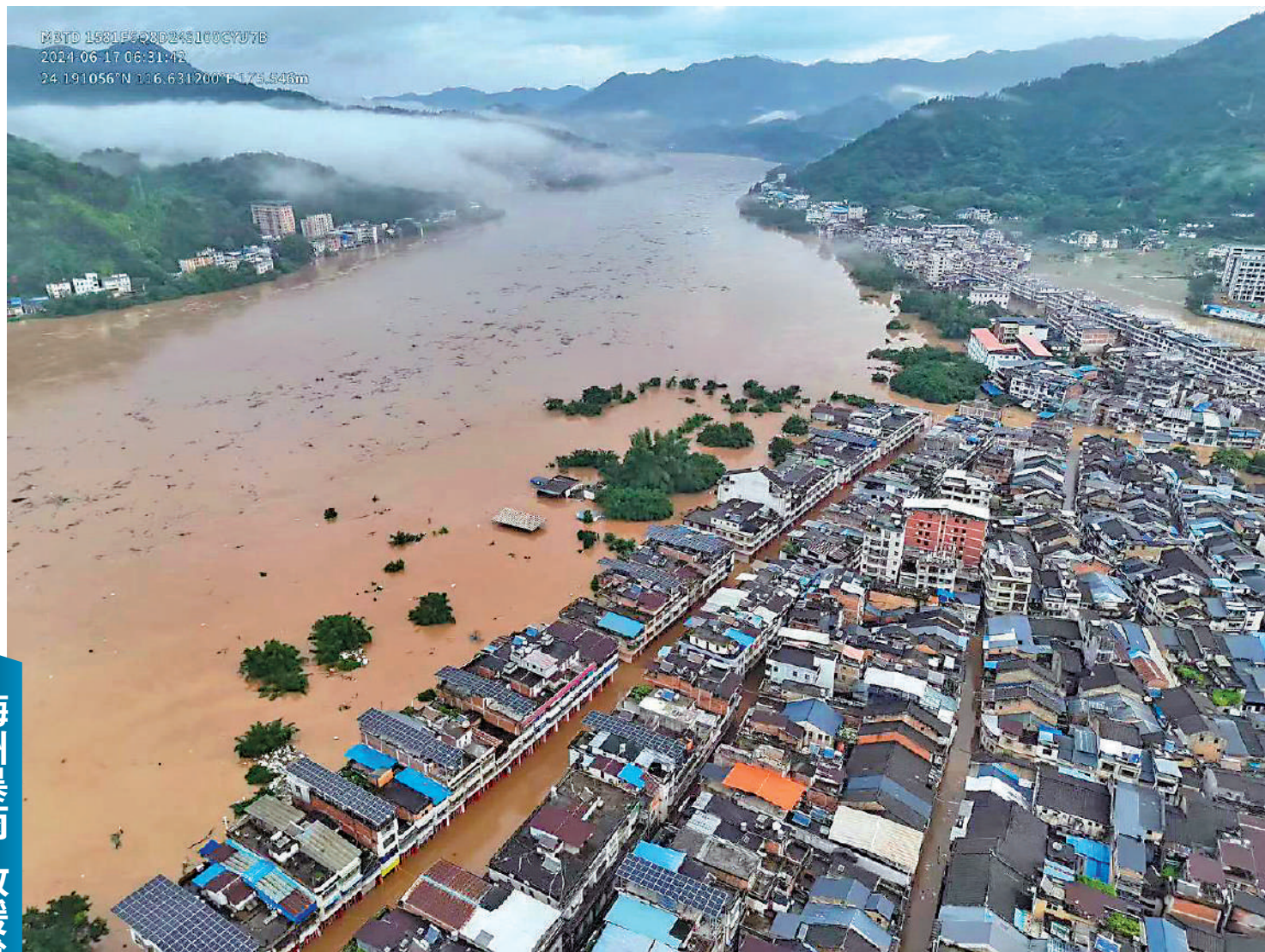
廣東梅州大埔縣高陂鎮在此次強降雨引發的洪災中受災嚴重。