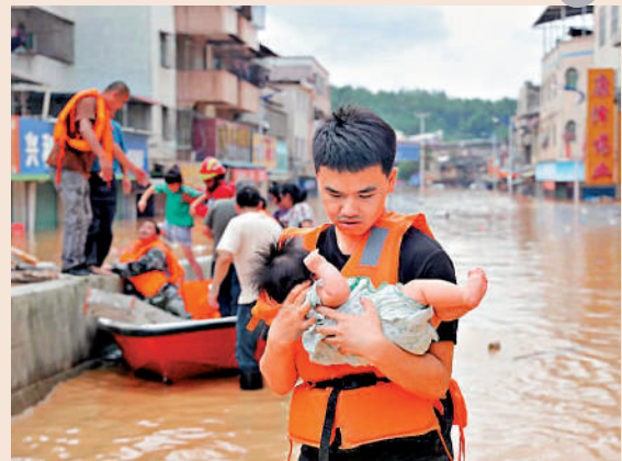
救援人員正在轉移受災群眾。