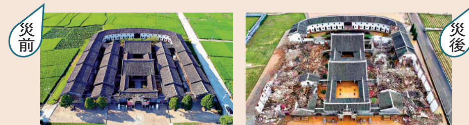
▲福建「客家第一宗祠」李氏大宗祠（左）因暴雨受損倒塌（右）。

16日至17日，福建省上杭縣茶地、盧豐等15個鄉鎮24小時降雨量突破歷史極值。據不完全統計，本輪強降雨已導致當地群眾4人死亡。截至17日20時，上杭全縣累計受災66498人，受災地區通訊、電力等基礎設施仍未完全恢復，部分地區仍存在山體二次溜坡風險，這給精準摸排、搜救失聯或被困人員帶來不小困難。