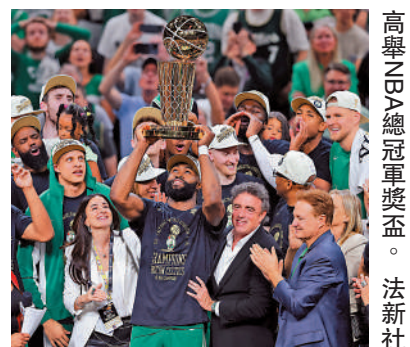
▲塞爾特人的積倫布朗（中）高舉NBA總冠軍獎盃。