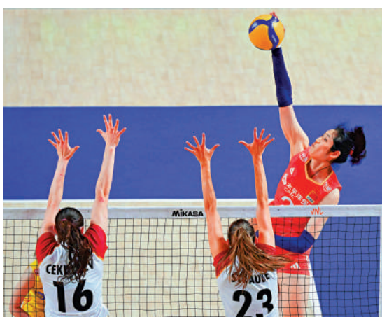
▲朱婷（右）留力出戰巴黎奧運。