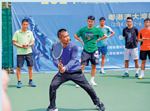
▲培養「複合型網球運動人才」既能教網球課，又能開運動處方。