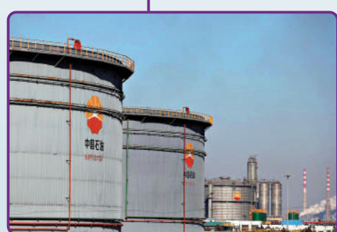
▲三桶油股價全線向上，中石油應聲升4.5%。