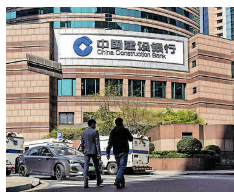
▲四大國有內銀股，是資金吸納的熱門收息股。

表現依然強勁。恒指公司提到，恒生中國內地企業高息率指數的股息率為6.2厘，年初至今總回報高達16%，而恒生中國高息率指數的股息率則為6.5厘，年內總回報逾12%，兩項高息率指數皆顯著跑贏大市。