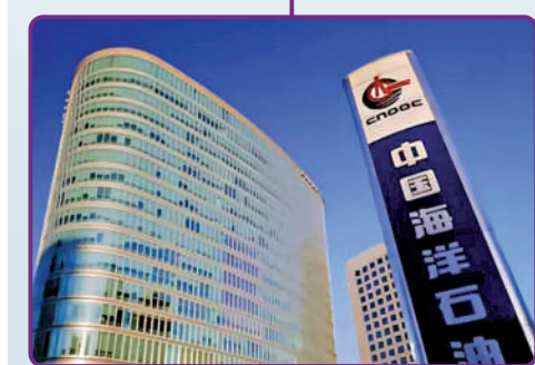
▲在港股通紅利指數中權重最大的中海油，股價創新高。