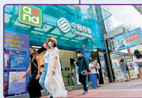
▲國家隊昨日出手，包括在內的電信板塊大漲。