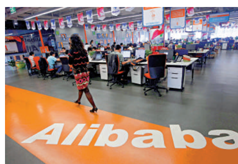
▲科技股昨日表現亮麗，阿里巴巴升近3%。