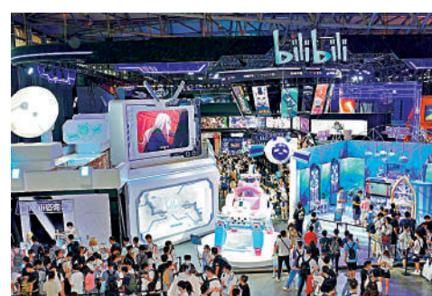
▲B站狂升近兩成，是昨日表現最佳的科技股。