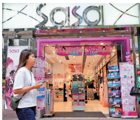
▲莎莎目前在港澳的核心旅遊區設有26間店舖。