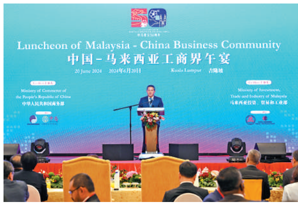
▲當地時間6月20日中午，國務院總理李強在吉隆坡出席中國—馬來西亞工商界午餐會並致辭。

李強指出，廣大企業作為中馬經貿合作的主力軍，是兩國關係健康發展的重要基礎。希望雙方企業繼續深耕兩國市場，用好用足《區域全面經濟夥伴關係協定》，不斷發掘貿易增長潛力，努力釋放投資合作動能，做互惠互利的踐行者；積極拓展綠色發展、