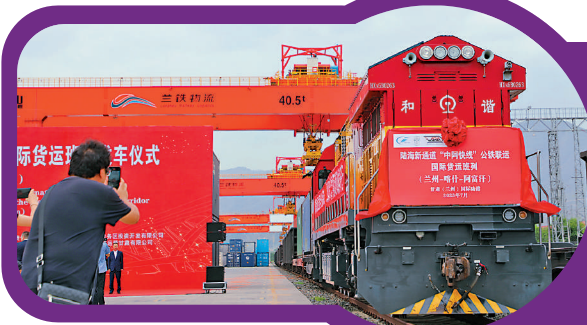
▲新疆築牢聯通歐亞的「黃金通道」。圖為陸海新通道「中阿快線」公鐵聯運國際貨運班列。