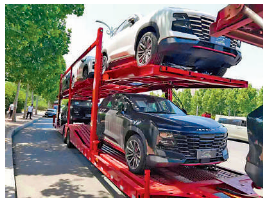
▲霍爾果斯綜保區以籠車形式出口商品車，大幅降低了運營成本。

據烏魯木齊海關統計，2023年，新疆口岸出口商品車56.8萬輛，同比增長407.6%，主要銷往哈薩克斯坦、烏茲別克斯坦等中亞國家。其中，霍爾果斯作為全國最大的汽車出口陸路口岸，2023年出口商品車30.4萬輛，同比增長307.5%，成為通關忙、韌性強、潛力大的重要絲路樞紐。今年以來，霍爾果斯鐵路口岸每天通行的中歐（中亞）班列數量保持在20列以上，平均2個小時就要完成一列入境返程中歐（中亞）班列的換裝，連續3個月班列通