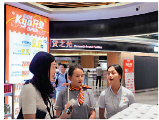
▲消費者在喀什跨境電商進出口商品展示交易中心購物。

如今，新疆公路網絡覆蓋天山南北；鐵路成網成環，北部、中部、南部三大國際運輸通道初步形成；航空網絡「東西成扇」。一個東聯國內市場、西挽中亞歐洲，貿易往來頻繁、支撐國家向西開放的黃金通道加快建成，助力西部地區的大開發。今年前四月，新疆與197個國家和地區產生貿易往來，對東盟、RCEP其他成員國、非洲、拉美均實現3倍以上的出口增速，對共建「一帶一路」國家進出口值同比增長46.6%，貿易夥伴更趨多元。