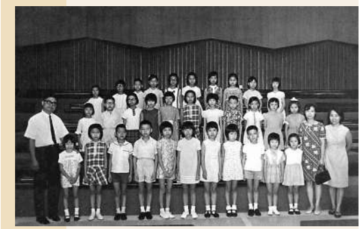
▲香港兒童合唱團於1969年7月26日在香港電台作錄音演出。