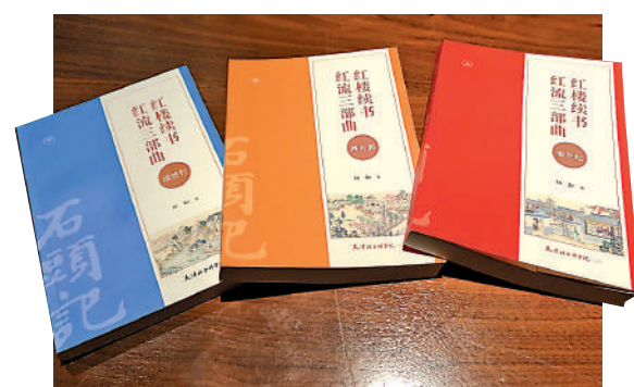
▲《紅樓續書·紅流三部曲》分為《榴花紀》《桃葉渡》和《凌波行》三冊。

【大公報訊】被譽為香港「兒童合唱團之父」的著名作曲家及音樂教育家葉惠康，畢生貢獻於推廣音樂藝術，除了致力音樂創作外，還在兒童音樂教育方面貢獻良多，培育一代又一代的音樂精英。他曾先後創辦香港兒童合唱團、泛亞交響樂團、葉氏兒童合唱團、香港兒童交響樂團等，成就卓越，是香港藝術家的楷模。他的離世無疑是香港音樂文化界的重大損失。為了向香港一代音樂家葉惠康致敬，緬懷他對香港音樂界的傑出貢獻，香港電台第四台將於今天（21日）晚上8時，播放2016年製作的訪問特輯《耕耘集：我的香港音樂故事》，與聽眾一同回顧葉惠康指揮的錄音演出，以及他燦爛的音樂人生。《懷念葉惠康——耕耘集：我的香港音樂故事（2016）》安排於港台第四台（FM97.6-98.9）播放；港台網站（radio4.rthk.hk）和流動程式「RTHK電台」同步播出及提供節目重溫。