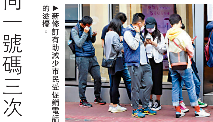
新修訂有助減少市民受促銷電話的滋擾。

金管局指出，優化《守則》由即日起生效，當局預期所有認可機構在《守則》所載之時限內會盡快跟從優化指引要求。