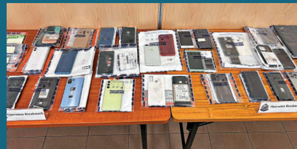
警方在破標行動檢獲大批手機及單據等證物。