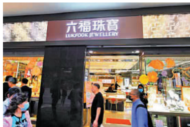
六福珠寶昨日證實有黑客入侵資料庫，1800名香港客戶的資料被盜取。

六福珠寶續指出，發現潛在事件後已立即啟動網路事件遏制和回應程序，包括中斷受影響的伺服器與集團網路的連接，並執行全面的反惡意軟體掃描。自調查開始至今，集團已採取更多遏制措施，包括但不限於定期監控其網路以識別潛在的惡意活動，以及僅允許與受影響的伺服器進行可信任的連接。六福集團還實施額外的安全措施，以防止同類攻擊再次發生，並保護客戶的隱私。