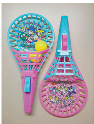
海關發現這款球拍彈射玩具可發射原裝配件以外的物件，恐對他人造成傷害。

根據《條例》規定，任何人供應、製造或進口不安全的玩具或兒童產品，即屬違法。違例者首次定罪，最高可被判罰款10萬元和監禁一年，而其後各次定罪則最高可被判罰款50萬元及監禁兩年。