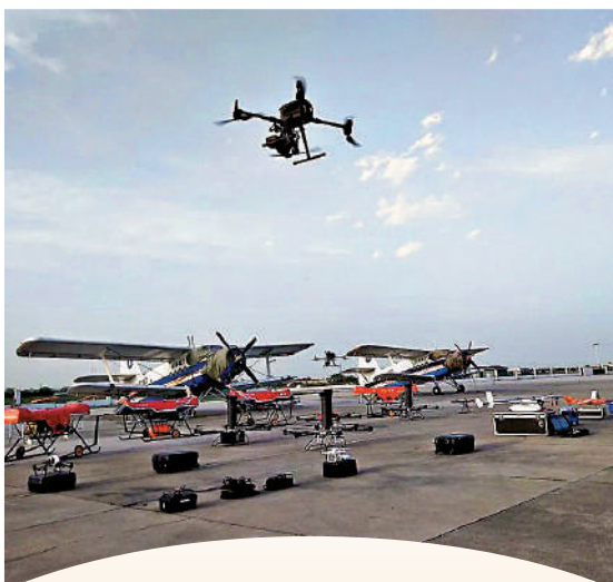
▲眾多航空公司在鄭州集聚，研發飛行器。