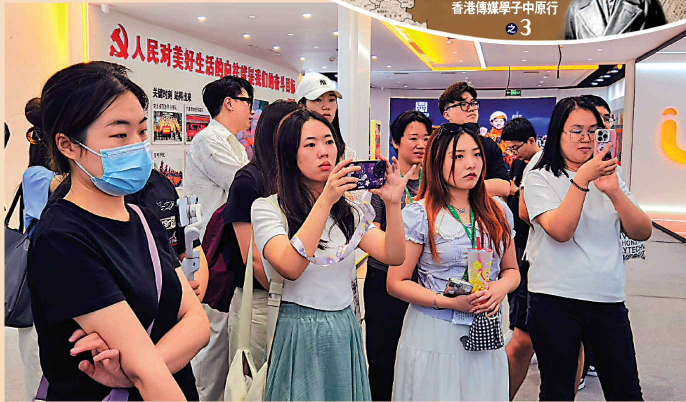
▲18日，「2024范長江行動中原行」的豫港學子來到鄭州同城即時生活服務平台「UU跑腿」參訪。

作為新質生產力的代表，低空經濟具有廣闊的發展前景，是產業發展的新賽道、經濟增長的新引擎。河南省鄭州市正搶抓低空經濟發展機遇，培育壯大低空經濟主體，並全力支持企業技術創新。18日，「2024范長江行動中原行」的豫港學子來到鄭州同城即時生活服務平台「UU跑腿」參訪，該公司最近開通了河南首批無人機物流配送航線，躋身低空經濟萬億市場角逐者。