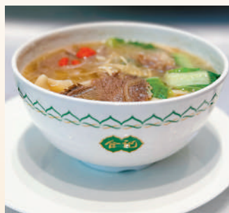
▲燴麵是鄭州美食代表。 大公報實習記者馬林興攝