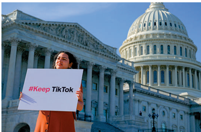
◀ 博主們在美國國會大廈抗議封禁TikTok。

卡巴斯基實驗室於1997年在莫斯科成立，是全球最成功的殺毒軟件公司之一。克里姆林宮發言人佩斯科夫21日表示，美國此舉是其「不公平、不正當競爭最慣用的方式，他們每次都這麼幹」。