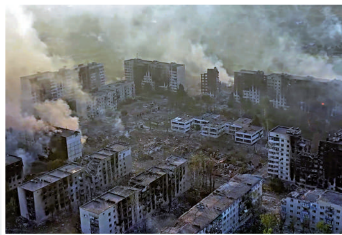
◀ 烏克蘭東北部前線城鎮沃夫昌斯克遭俄軍空襲。