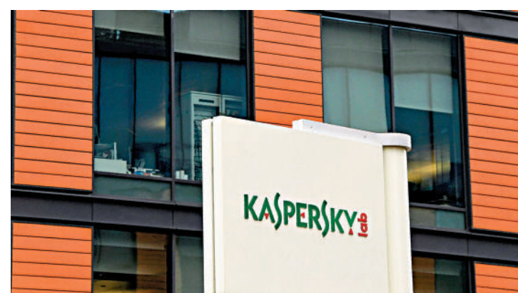
◀ 卡巴斯基公司位於莫斯科的總部外。