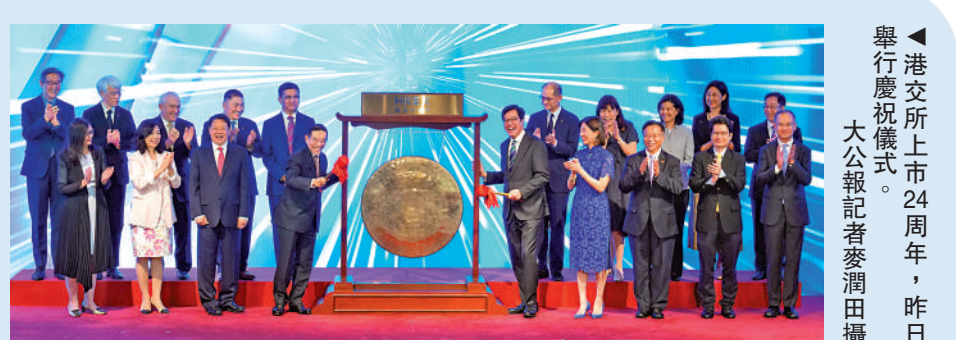
▲港交所上市24周年，昨日舉行慶祝儀式。

本港首季IPO全球排名跌至第10位，但近月港股走勢明顯轉佳，成交量持續上升，不少新股獲超額認購，而且上市後的表現令人滿意。唐家成對新股市場前景有信心。他透露，目前正在審批的上市申請約110宗，有73宗為今年