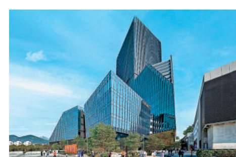
▲友邦香港進駐啟德Airside的高樓層辦公室。

友邦香港表示，全新四層辦公室位於Airside大樓高層，而且交通便利，連接啟德港鐵站，附近並設有多條公共巴士及跨境巴士線，方便財務策劃顧問及客