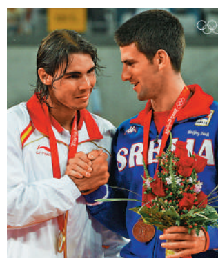
▲拿度（左）與祖高域（右）曾參與2008北京奧運，分別奪得金牌及銅牌。