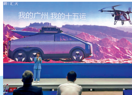
▲廣州的科技企業，表達了將賽會運行智能科技落地港澳的願望。