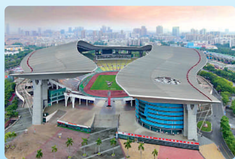
▲廣東奧林匹克體育中心的現狀及升級效果圖。