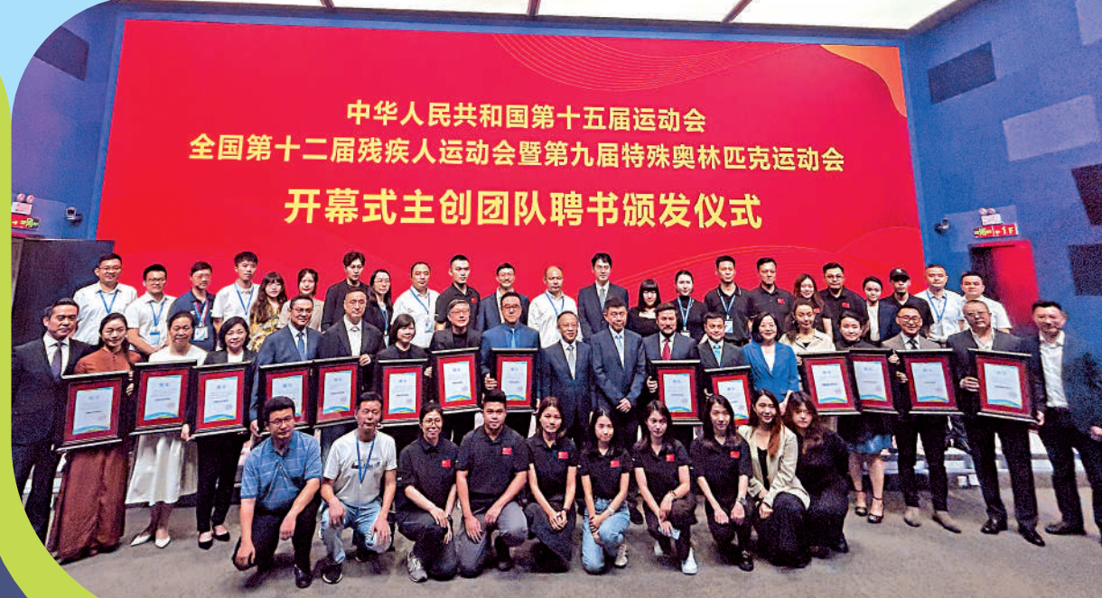
▲十五運開幕式主創團隊及各創作環節骨幹。

●香港詞作家，曾創作北京奧運歌曲《奧運北京》和慶祝香港特區成立二十周年歌曲《香港·我家》。