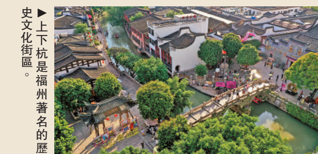
上下杭是福州著名的歷史文化街區。