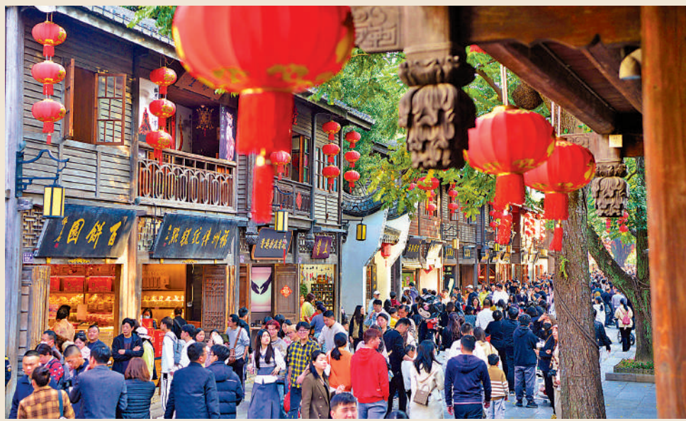
三坊七巷坐落福州鼓樓區南後街。