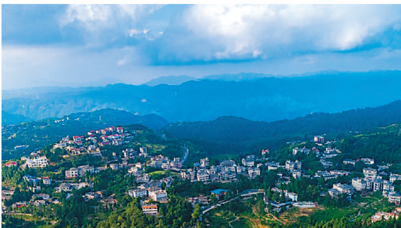
鼓嶺在福州市郊鼓山之北，山上建有300多棟風格各異的避暑別墅。