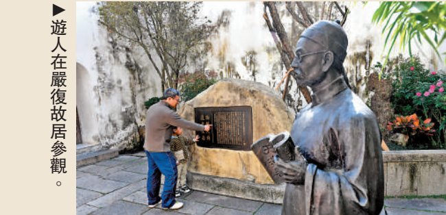
遊人在嚴復故居參觀。