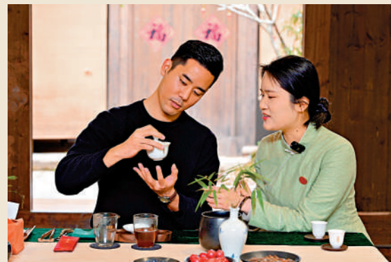
在上下杭街區可體驗福建功夫茶。

夏日的夜晚，上下杭三捷河兩岸華燈漸亮，登上一艘福船緩緩搖盪夜遊，岸邊的老樹、古厝、紅燈、小橋、人家，空氣中瀰漫着茉莉花、白玉蘭的沁香，巷陌深處幾聲閩劇唱腔，還有那福州魚丸的叫賣聲……恍惚間，似穿越回百年前「百貨隨潮船入市，萬家沽酒戶垂帘」的商賈鬧市。