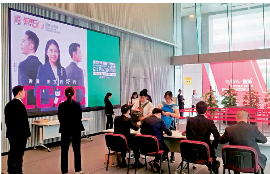
廉署舉辦招聘體驗日，四場活動料接待一千人。