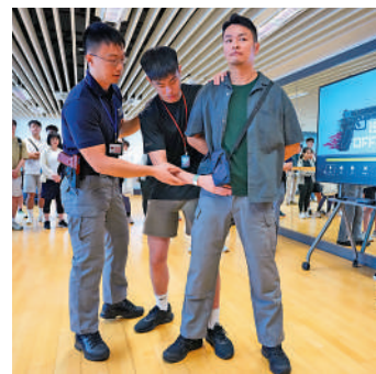
參加者亦可以親身參與模擬拘捕及搜查行動。