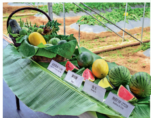
▲(左起)四款特色有機西瓜品種，超甜黑美人168、黛安娜、皇玉及無籽3F-2728。