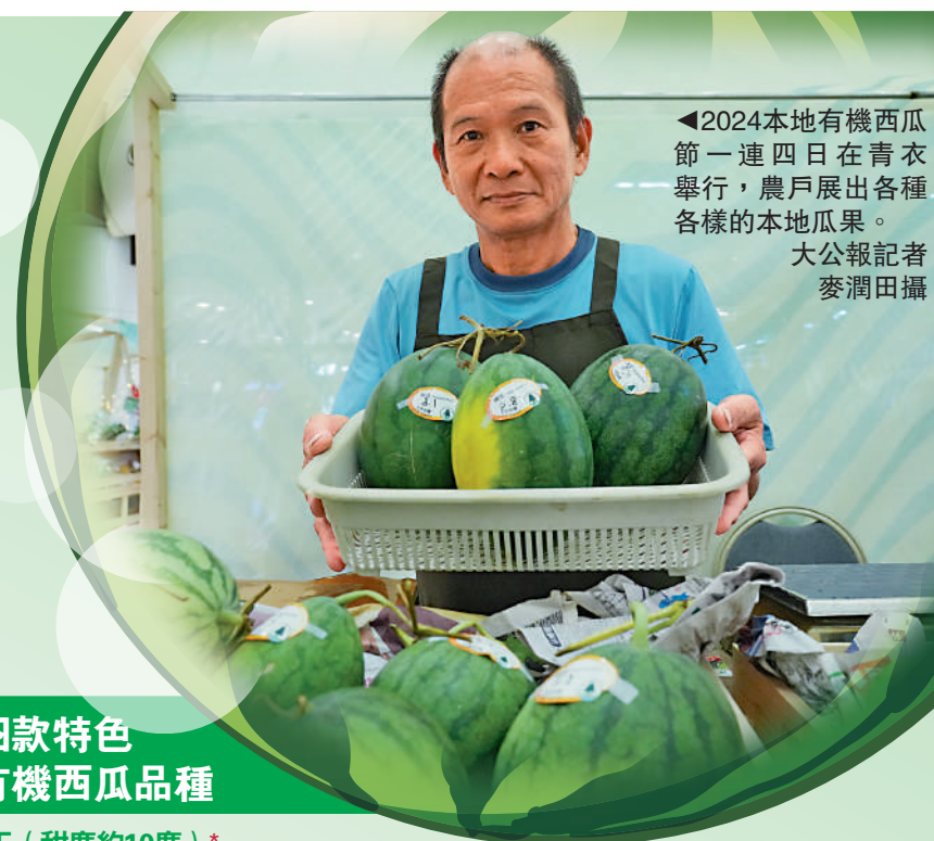
◀2024本地有機西瓜節一連四日在青衣舉行，農戶展出各種各樣的本地瓜果。