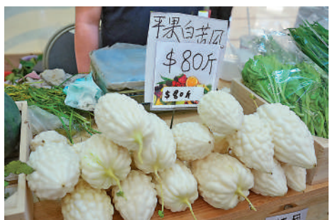
蛋糕材料，或加入咖啡中可帶出檸檬香甜味；將果皮切成薄片或擠出汁，可製作檸檬水或檸檬茶。大公報記者鍾佩欣

本地產的有機香水檸檬皮清香、味甜爽口，吸引不少市民圍觀，農戶鄧先生說，檸檬果皮較厚，但汁水香氣濃郁，將皮刨成細絲或切成薄片，可成為