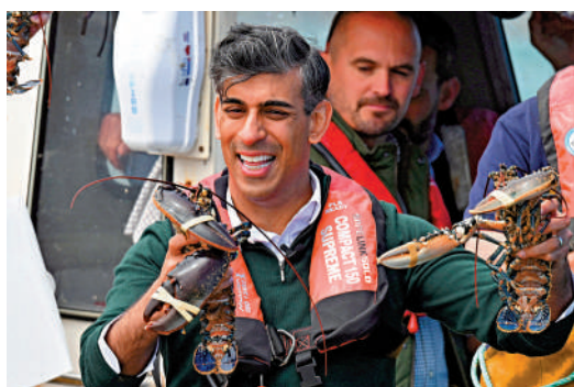
▲英國首相蘇納克18日在海港城市多佛拉票。

蘇納克20日表示，聽聞有關針對黨內同僚的指控他「非常憤怒」，說這是「非常嚴重的問題」。