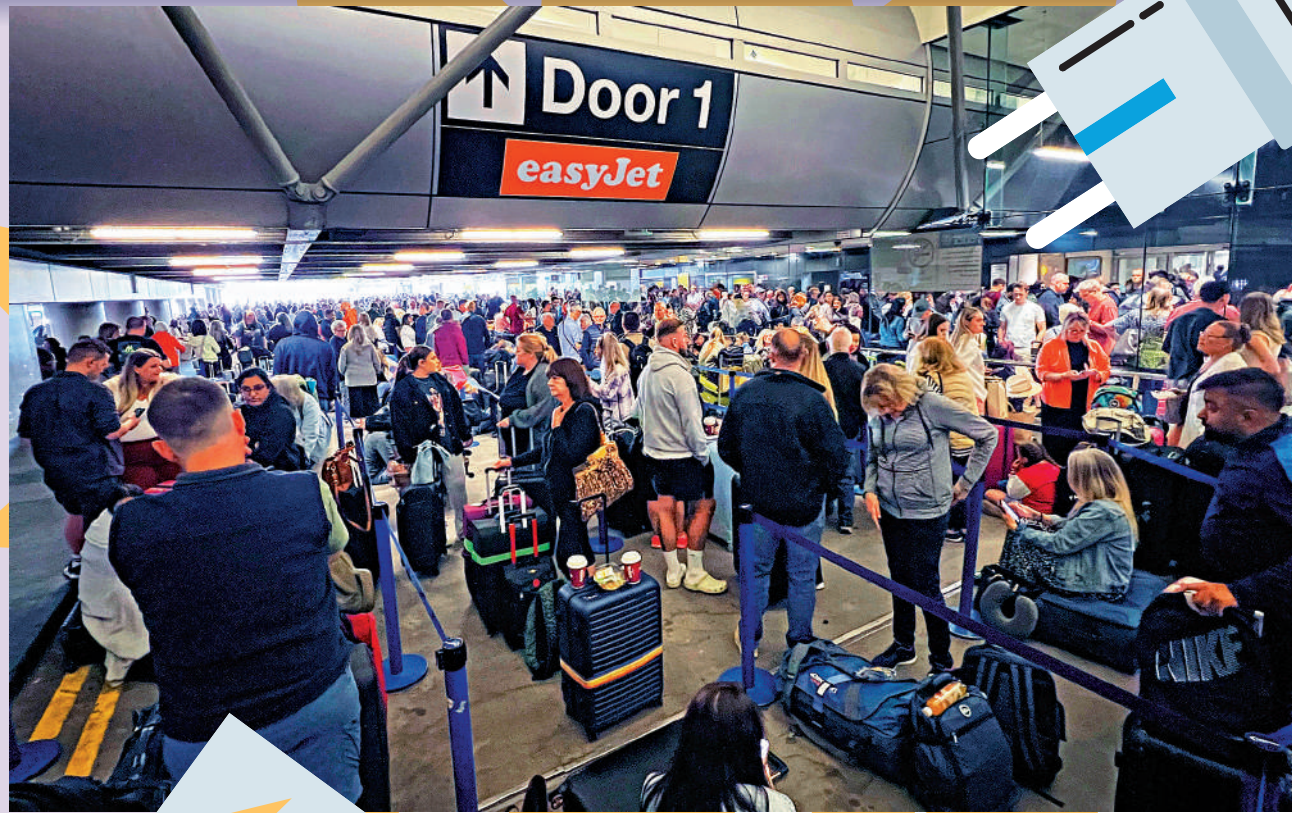
英國曼徹斯特機場23日停電，大量旅客滯留。路透社