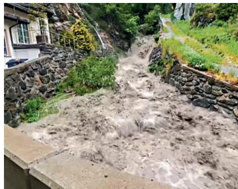
▲瑞士滑雪勝地策馬特21日發生嚴重洪災，道路被沖毀。

瑞士政府氣象部門稱，周五該地區降雨量達124毫米，其中大部分降雨量是在一小時內降下的。氣象局發言人說：「這種集中降雨的情況每30年才會出現一次。」瑞士總統阿梅赫德說，她對損失的規模感到震驚。