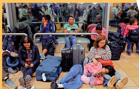
秘魯豪爾赫·查韋斯國際機場3日跑道照明系統發生故障，導致旅客滯留。