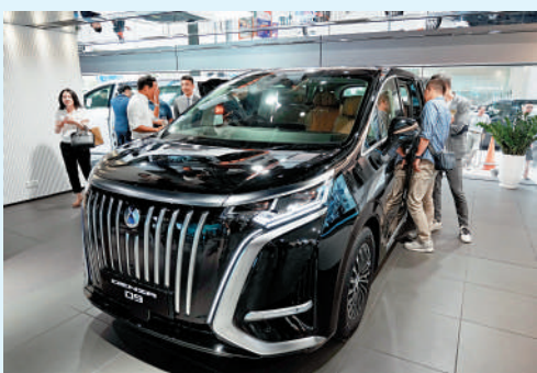
▲騰勢D9是2023年內地MPV年度銷量冠軍。