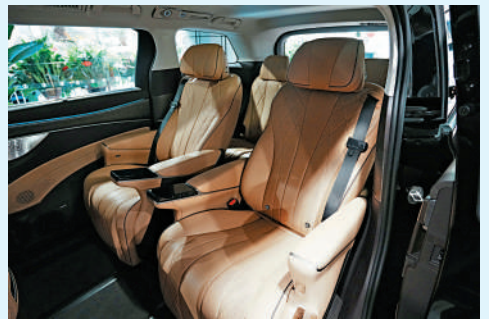
▲騰勢D9作為新能源豪華汽車，內籠空間十分寬敞。