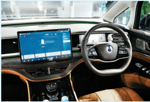
▲騰勢D9為駕駛者設置的特大屏幕，獲得用家高度評價。