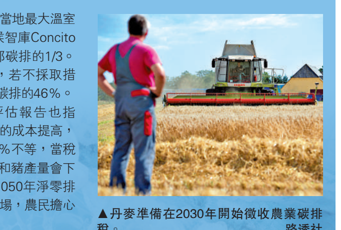
▲丹麥準備在2030年開始徵收農業碳排放稅。

每排放一噸二氧化碳，將被徵稅300克朗（約337港幣），5年後稅率調升至每噸750克朗（約842港幣），但可享有折扣。丹麥的計劃是在2030年減少180萬噸碳排放，有望在2030年時能達成減少70%的溫室氣體排放的減排目標。丹麥政府也會投入400億克朗（約449億港幣）的費用，協助農業轉型。丹麥徵收碳稅是效法新西蘭，而農業碳稅問題在新西蘭當地引發爭議，新西蘭當局在本月稍早表示，碳稅政策要推遲到至少2030年。丹麥是乳品與豬肉銷售大國，超過