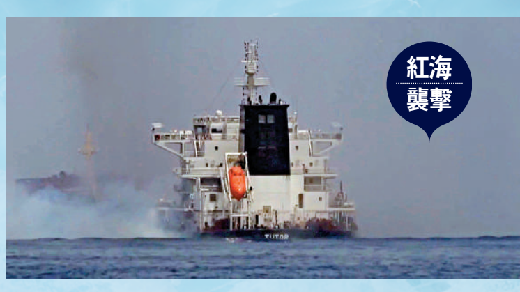
▲6月12日，希臘商船「Ionian」號在紅海遭胡塞武裝襲擊後濃煙滾滾，胡塞武裝宣稱襲擊後濃煙滾滾，胡塞武裝宣稱襲擊後濃煙滾滾。

全 球航運危機持續，也門胡塞武裝在紅海的襲擊，讓大批準備通過蘇伊士運河的船隻被迫繞行非洲好望角，而巴拿馬運河因中美洲乾旱水量不足限制通行。全球兩大主要運河的航運充滿變數。另外，美國、德國及加拿大的港口及鐵路運輸工人都要罷工，在多重因素影響下，近期海運價格持續走高，讓全球運輸成本再次飆升，全球供應鏈恐怕將再次出現危機。