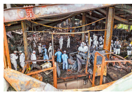
▲韓國警方和調查人員25日進入發生火災的華城電池廠進行調查取證。

方將通過韓國駐外國使館進行比對。涉事電池廠火災事發時的監控錄像25日公開。視頻顯示，事發時，廠房二樓堆放電池成品的區域突然冒出白煙，現場工作人員隨即尋找冒煙的電池組來源，在挪動電池組的過程中，堆放電池的區域起火並發生爆炸，工人試圖滅火並未成功，最後爆炸和火光吞噬了整個車間，位於二層的工人最終未能及時逃出而遇難。中國外交部發言人毛寧25日表示，中方已要求韓方盡快查明華城電池工廠火災事故原因，全力救治傷員，做好善後處理，並為中國傷亡人員家屬提供協助。毛寧表示，「我們對事故中不幸遇難人員深表哀悼，向傷者和遇難者家屬表示誠摯慰問。」中國外交部和中國駐韓國大使館第一時間啟動領事保護應急機制，全力開展事故應急處置和善後工作。