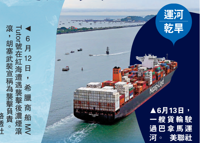
▲6月13日，一艘貨輪駛過巴拿馬運河。

【大公報訊】去年巴以衝突爆發後，也門胡塞武裝從11月起持續向經過紅海的國際商船開火，目前已有兩艘船隻遇襲後在紅海海域沉沒。許多往來亞洲、歐洲與美國東岸的船隻因此避走紅海，繞遠道走非洲好望角路線，使得航程延長至少兩周，運費不斷攀升。目前，通過蘇伊士運河的集裝箱運輸量下降到平時的十分之一。