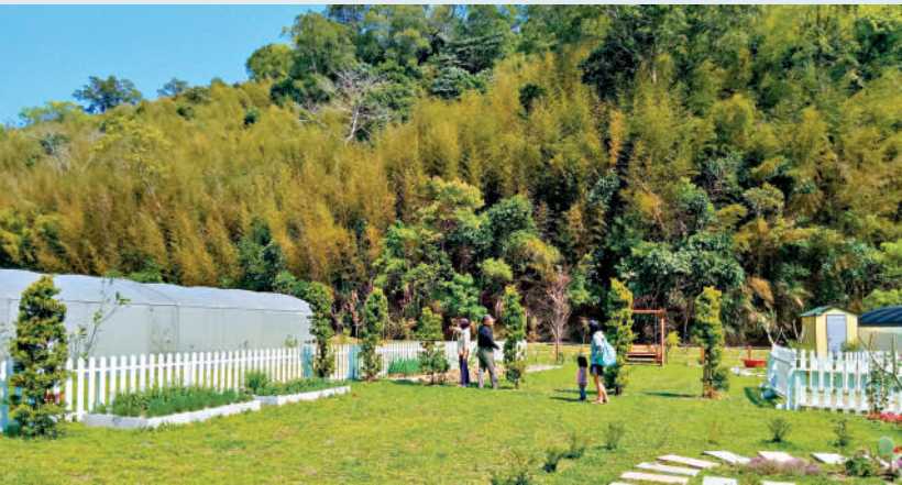
▲漁農署推出「農＋樂」計劃，容許商業農場提供無火煮食等，發展休閒農業。