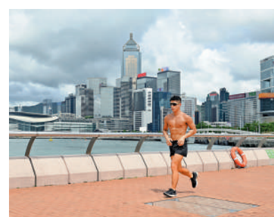
▲海濱事務委員會大部分委員支持修例建議。