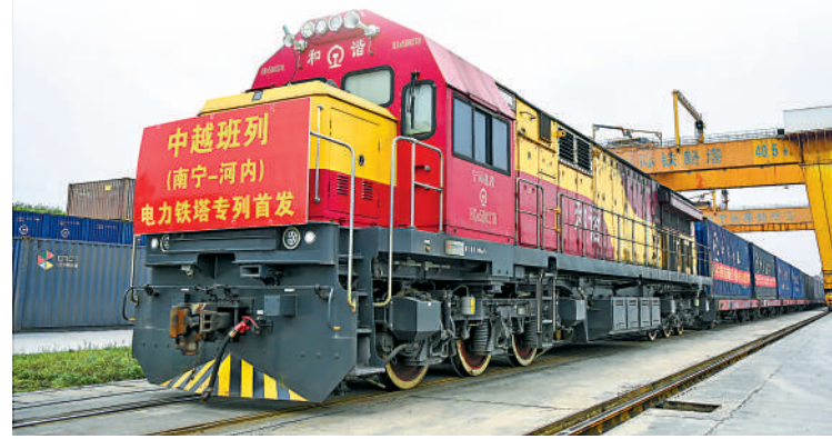
▲3月8日，滿載的塔的中越班列從廣西南寧國際鐵路港開出，發往越南河內。