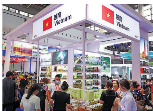
▲觀眾在第四屆消博會上了解越南展品。

范明政表示，越方支持中方在台灣問題上的立場，堅定恪守一個中國原則，將深化越中戰略互信和務實合作、構建具有戰略意義的命運共同體作為越南對外政策的頭等優先和戰略選擇，不會受到外界的挑撥離間和干擾破壞。習近平總書記、國家主席去年對越南進行的成功國事訪問是越中關係的歷史里程碑。越方願同中方一道，認真落實此訪重要成果，按照「六個更」的總體目標，不斷增進政治互信，深化務實合作，鼓勵青年交流，築牢民意基礎，加強多邊協作，妥善處理分歧，切實推進具有戰略意義的中越命運共同體。