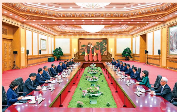
▲6月26日下午，國家主席習近平在北京人民大會堂會見來華出席夏季達沃斯論壇的越南總理范明政。

6月26日下午，國家主席習近平在北京人民大會堂會見來華出席夏季達沃斯論壇的越南總理范明政。習近平強調，中越命運共同體建設開局良好，給兩國人民帶來實實在在的利益。中國始終把越南視為周邊外交的優先方向，堅定支持越南走符合本國國情的社會主義道路。中方願同越方加強戰略引領，圍繞「六個更」總體目標，堅持團結友好，堅定相互支持，深化互利合作，攜手邁向現代化，為世界和平、穩定、發展、繁榮作出更大貢獻。雙方要妥善處理海上問題，加快推進海上共同開發，共同維護地區和平穩定。