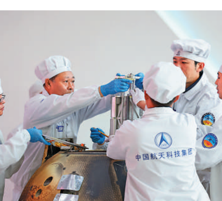
▲儀式現場，科研人員對嫦娥六號返回器進行開艙，檢驗關鍵技術指標完成情況。新華社

據了解，未來這些樣品將在密封狀態下被運至位於中國科學院國家天文台的月球樣品實驗室。月球樣品實驗室由外及裏共有三個房間，嫦娥六號月球樣品抵達後，將在第一個房間進行解封，