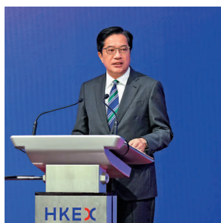
▲財政司副司長黃偉倫指出，本港可為主要跨境商品市場。