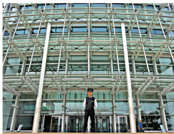
▲金管局進行歐元體系探索工作，冀實現全日跨境同步結算。

另外，惠譽表示，過去一年亞太地區銀行面臨的按揭貸款風險有所下降，原因是較高的利率水平和新冠疫情紓困政策的取消，已在很大程度上被消化，且未對市場造成顯著影響，同時低失業率及多個市場銀行的審慎信貸標準，也對其業績表現形成支撐。不過，惠譽指商業地產的風險有所攀升。