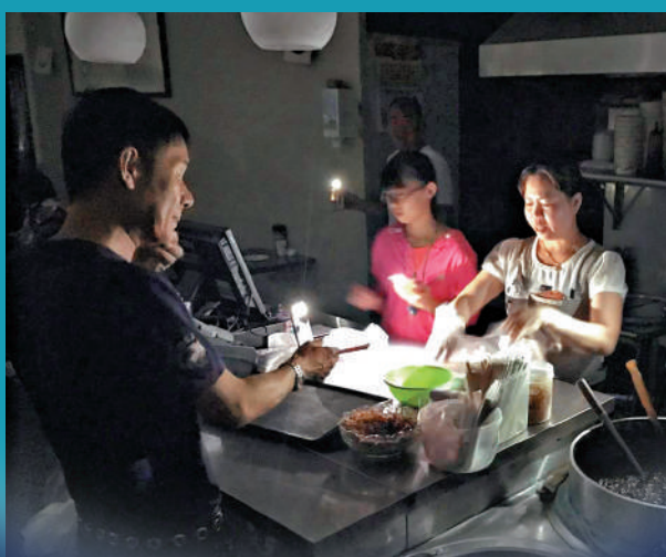
▶台灣民眾批評民進黨當局能源政策錯誤，導致島內頻頻停電。資料圖片