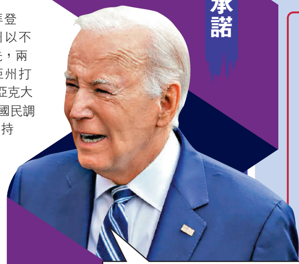
美國現任總統拜登