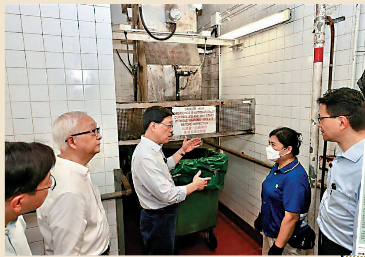
▲李家超5月親身到柴灣連翠邨，了解清潔工在垃圾收費先行先試計劃後工作量倍增，成為叫停計劃的原因之一。