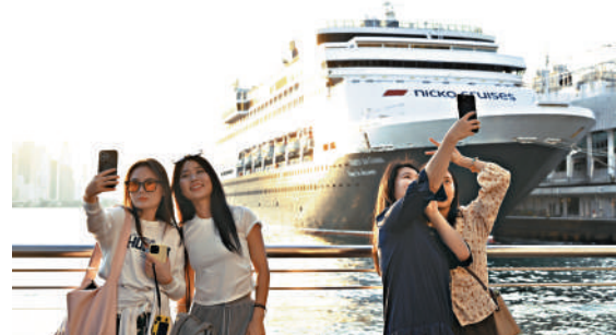
▲「個人遊」計劃不斷擴展，至今已共開放59個城市，支持香港的旅遊業。

特區政府官員近年頻頻外訪「說好香港故事」。陳茂波透露，由去年開始他先後到訪歐洲、美國等地，深深體會到受通關及地緣政治影響，外地人對香港情況不了解，復常通關後，能讓更多旅客來港感受香港活力，相信他們回到居住地後可以將香港實情口耳相傳，帶動下一波旅客來港。