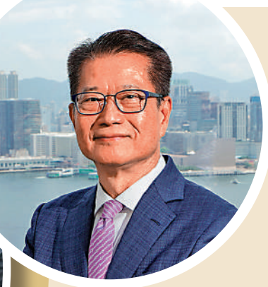
▲財政司司長陳茂波強調，深信香港的財富管理規模，日後必定超過瑞士。

▲管理中心。截至2022年年底，香港資產及財富管理業務總值超過30.5萬億港元（3.9萬億美元），是亞洲最大的對沖基金中心和跨境財富管理中心。