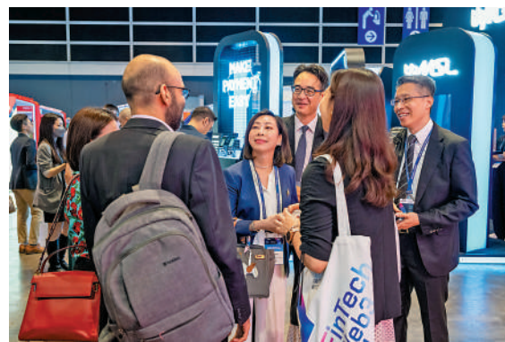
▲香港積極舉辦盛事，吸引大量旅客來港，振興旅遊業。圖為在香港舉行的金融科技周。