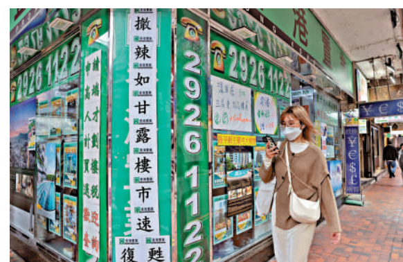
▲樓市「撇辣」後升勢減弱，但市場仍然剛需，樓價預計不會大跌。

陳茂波表示，不同機構及企業均有意推動北都發展，特區政府希望北都的發展，多些用市場資金、用社會資源，因此與私人市場合作是其中一個方案，在此方案中可以有不同形式，如一個片區開發是否可考慮交予一些私人機構去做，主要考慮可運用外部資金，以及能否提升效率及速度等；發展一些大型項目時，亦會研究在一些項目中適當地發債，讓市民參與項目同時享有穩定回報。