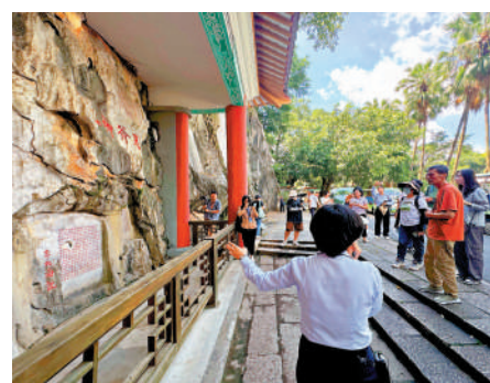
記者在七星岩景區拍攝。