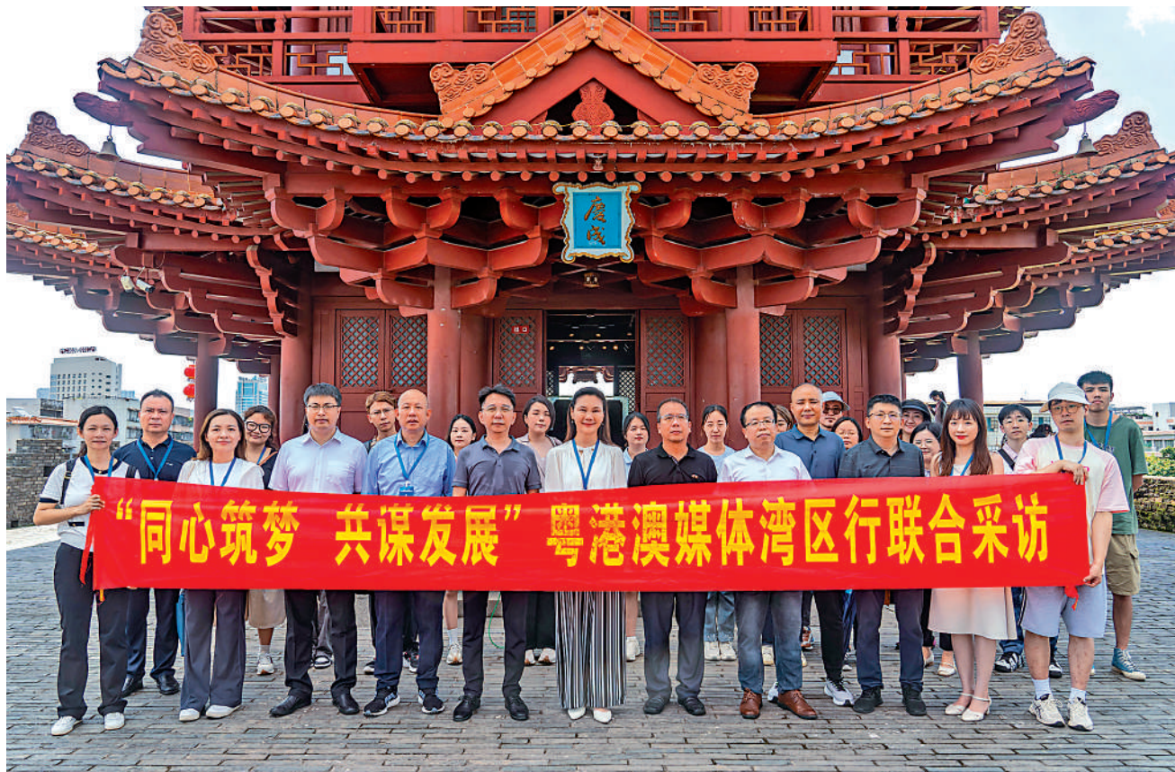
6月28日，「同心築夢·共謀發展」粵港澳媒體灣區行聯合採訪團到肇慶，在宋城牆合照。