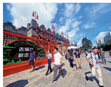
採訪團走訪肇慶宋城牆。