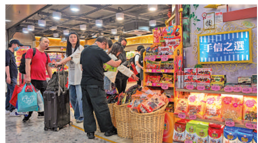
▲訪港內地遊客在香港西九龍高鐵站選購手信。

「我朋友還沒有去過香港，聽說這個事情之後，也挺興奮的。考慮這個暑假的畢業旅行就去香港。」在史小姐看來，香港很有文化底蘊，「而且香港其實挺大的，只去一次確實逛不完，我肯定還會去第二次、第三次。」