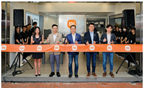
小米在銅鑼灣新設門店。

目前，計及銅鑼灣怡和街的新店，小米之家在香港共有15店，今年將在香港市場推出多款新產品，未來亦會繼續增強線上及線下銷售網絡部署，滿足香港不同客戶群需要。