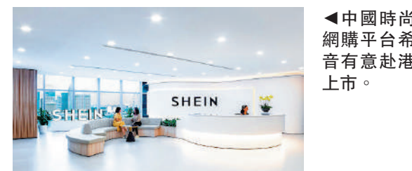
中國時尚網購平台希音有意赴港上市。

今年早些時候，SHEIN曾向美國監管部門遞交上市申請，惟相關進程陷入膠着。目前SHEIN估值500億英鎊（約4938.9億元）。消息指出，SHEIN去年實現322億美元銷售額，按年增長四成，超過歐洲時裝巨頭Zara及H&M，純利亦擴大至16億美元，若成功在倫敦上市，有望成為倫敦證交所超過10年來最大宗新股發行。