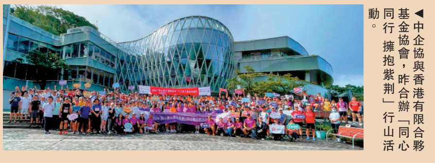
中企協辦與香港有限合夥基金協會，昨合辦「同心同行 擁抱紫荊」行山活動。

「爬山怕曬，今天涼快，路面即使濕一些也沒關係。」來自深圳的越野組參賽者表示，他一大早搭乘高鐵抵達西九龍，「我們經常在深圳舉辦行山活動，其中梧桐山是一個不錯的選擇。」