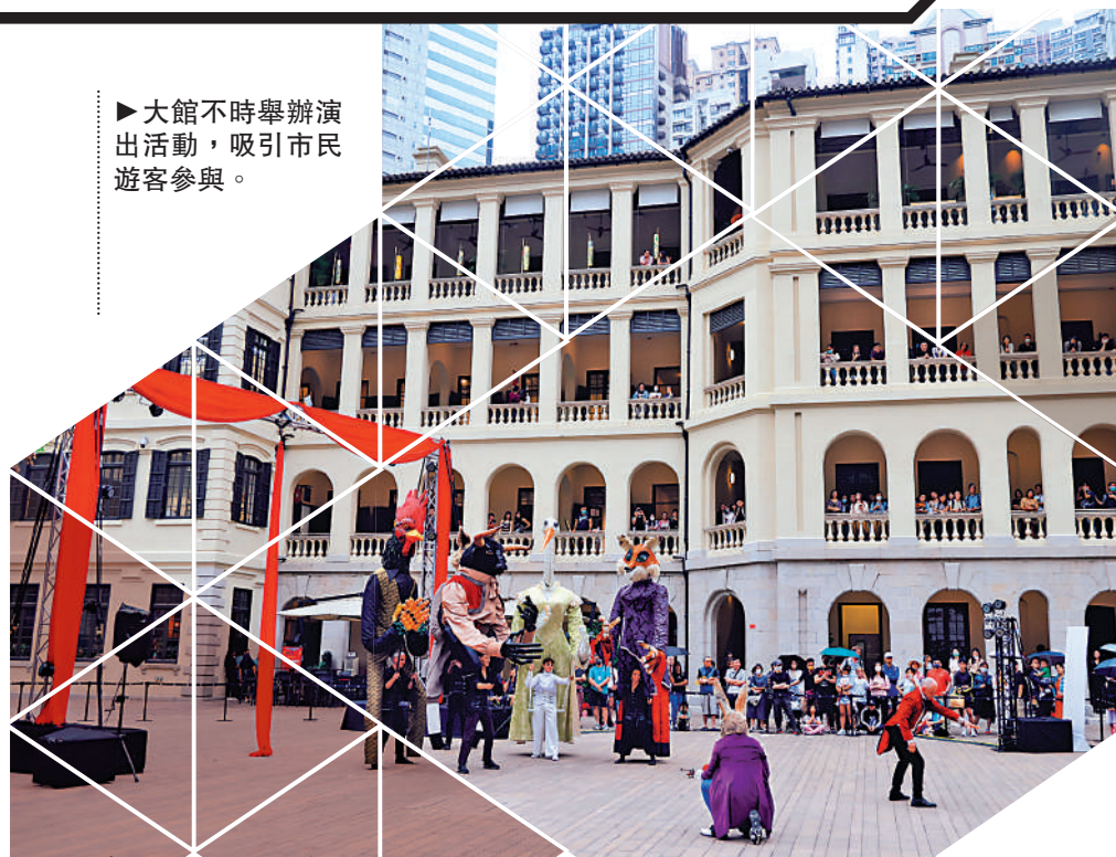
▶大館不時舉辦演出活動，吸引市民遊客參與。

從大館建築群走出，檢閱廣場兩旁還有酒吧餐廳，逛累了，坐下喝杯冷飲，再加上開闊的城市視野，暑氣也去了大半。