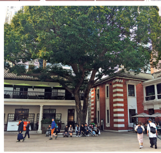
▲大館的歷史建築展新姿。