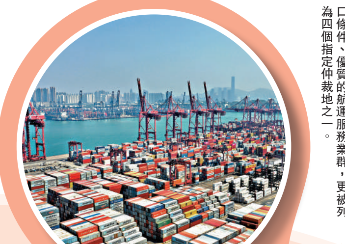
▲香港是國際的航海中心，具備理想的港口條件、優質的航海服務業群，以及優良的營商環境。

(5) 至於推進發展北部都會區方面，現屆政府正全力推展有關工作，而未來十年香港新增可發展的用地將有約四成是由北部都會區所產出。北部都會區面積達30,000公頃，約為香港總面積的三分之一，毗鄰深圳，連繫50個邊境管制站。當中約3,000公頃為新發展土地，除可供應50萬個新增屋單位外，亦可拓闊香港的產業發展版圖。北部都會區由西至東分為四大區段，包括高端專業服務和物流樞紐、創新科技地帶、口岸高貿及產業區，以及藍綠康樂旅遊生態園。除滿足香港自身需要外，北部都會區亦將成為香港與深圳以至其他大灣區城市協同發展的重要平台，從而促進特區