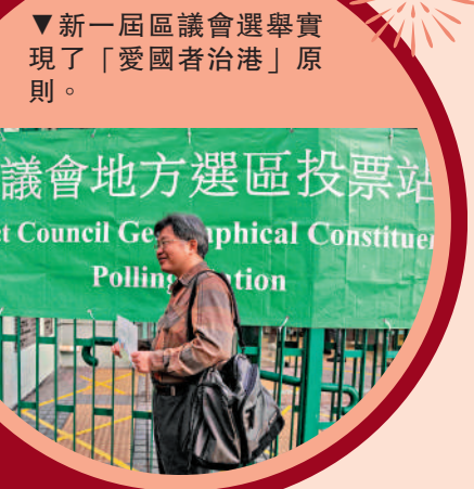
▲新一屆區議會選舉實現了「愛國者治港」原則。