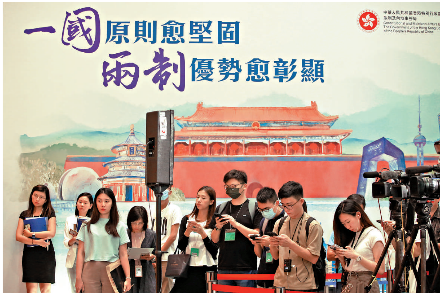
▲在「一國兩制」的制度優勢和祖國的堅強後盾支持下，香港一次又一次克服艱難險阻，穩步前行。