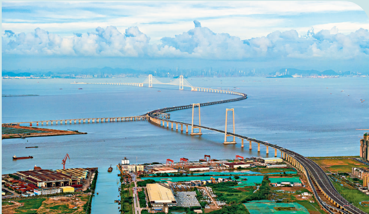
▲深中通道不僅極大地縮短了深圳與中山之間的車程，更為粵港澳大灣區的發展帶來深遠的積極影響，交通網絡的完善，成為助推大灣區各方面發展的重要動力。

深中通道正式通車試運營，國家主席習近平發來賀信表示熱烈祝賀，並要求深中通道充分發揮交通開路先鋒作用，促進珠江口東西兩岸融合發展，提升粵港澳大灣區基礎設施「硬聯通」和規則機制「軟聯通」水平，推進粵港澳大灣區市場一體化。