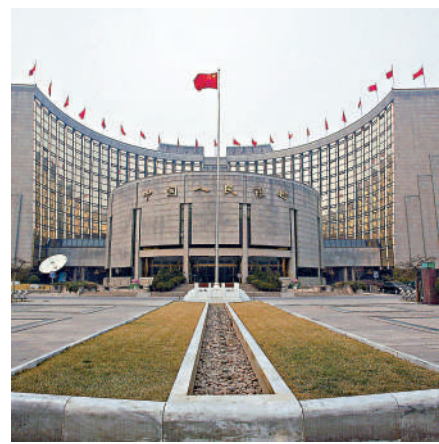
▲人民銀行終決定出手，昨日宣布借入國債，令10年期債息大幅反彈。