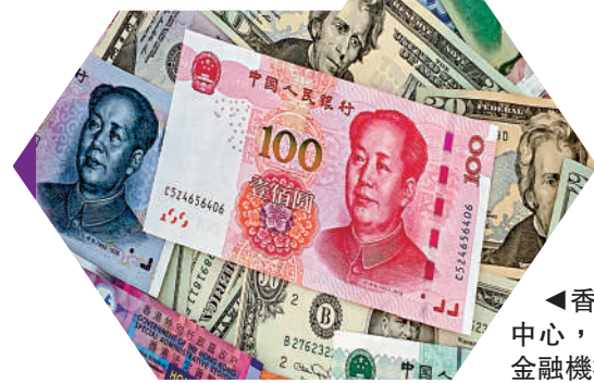
▲香港是全球最大的離岸人民幣中心，吸引了大量的國際投資者和金融機構。