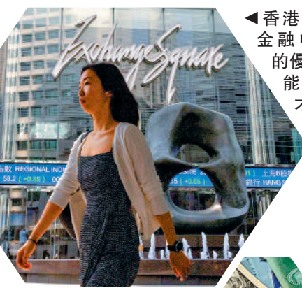
▲香港擁有國際金融中心的優勢，自然能夠吸引人才前來尋找機會。