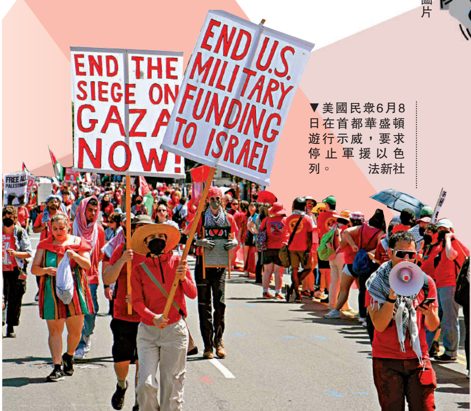
▼美國民眾6月8日在首都華盛頓遊行示威，要求停止軍援以色列。