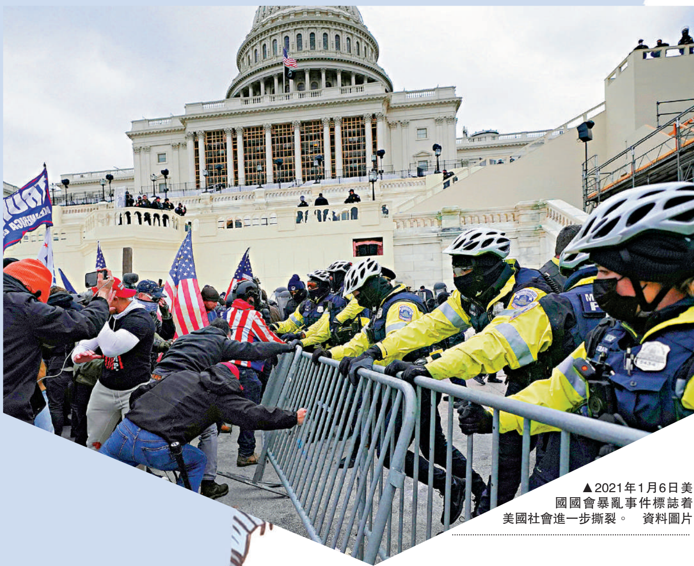
▲2021年1月6日美國國會暴亂事件標誌着美國社會進一步撕裂。 資料圖片