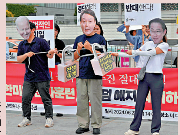
▶韓國民眾6月27日在首爾示威，反對美國拉攏日韓搞「小圈子」。