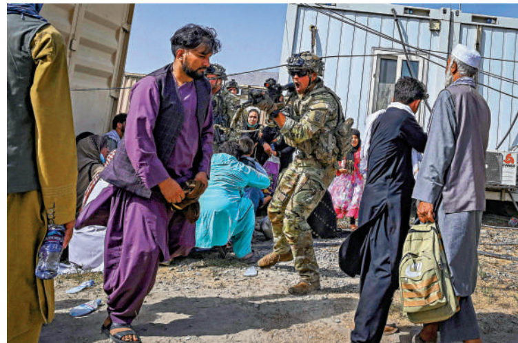
▶美國「輸出民主」導致阿富汗更加動盪。

今年4月20日，美國國會眾議院批准總額950億美元的對外援助法案，包括對以色列援助141億美元和對烏克蘭援助600億美元，其中絕大多數資金其實都落入美國軍火商的腰包。