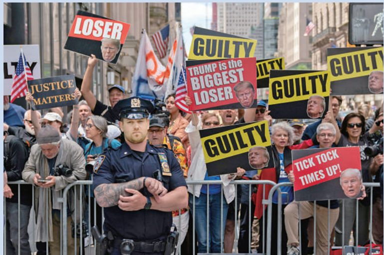
▲特朗普的反對者5月31日在紐約示威。

美國政客在國際舞台上不斷宣揚「美式民主」，但在現實中，「美式民主」弊病百出、亂象叢生，對內製造分歧，對外輸出衝突，日益暴露出這件帝國「華袍」內的不堪。今年3月，在所謂第三屆「民主峰會」會場內，美國國務卿布林肯大談「民主」；會場外，大批示威者手舉「反對美國霸權」標語。新華社撰文起底「美式民主」真相，揭露其反民主本質、工具本質和虛偽本質。