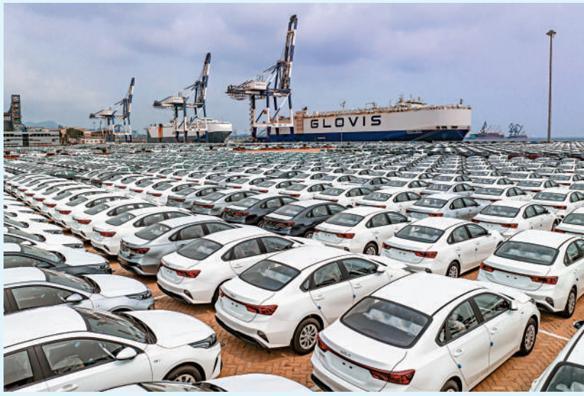
為1201.5億美元，同比增長6%。今年首5個月計，中國汽車商品累計進出口總額