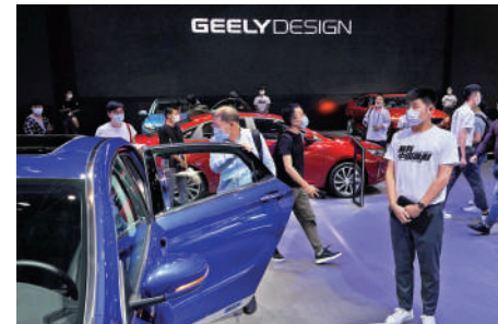
▲吉利銷量走勢維持強勁，5月乘用車銷量16.1萬輛，同比增長38%。

市，該行預期新能源車型銷量會加快。報告指，吉利下半年主推純電車型，包括銀河E5、領克Z10和極氪Mix。隨着下半年新能源車型上市和出口加速布局，有望支持銷量持續改善。該行維持其「買入」評級和目標價12.5元。