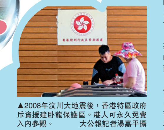
▲2008年汶川大地震後，香港特區政府斥資援建臥龍保護區。港人可永久免費入內參觀。