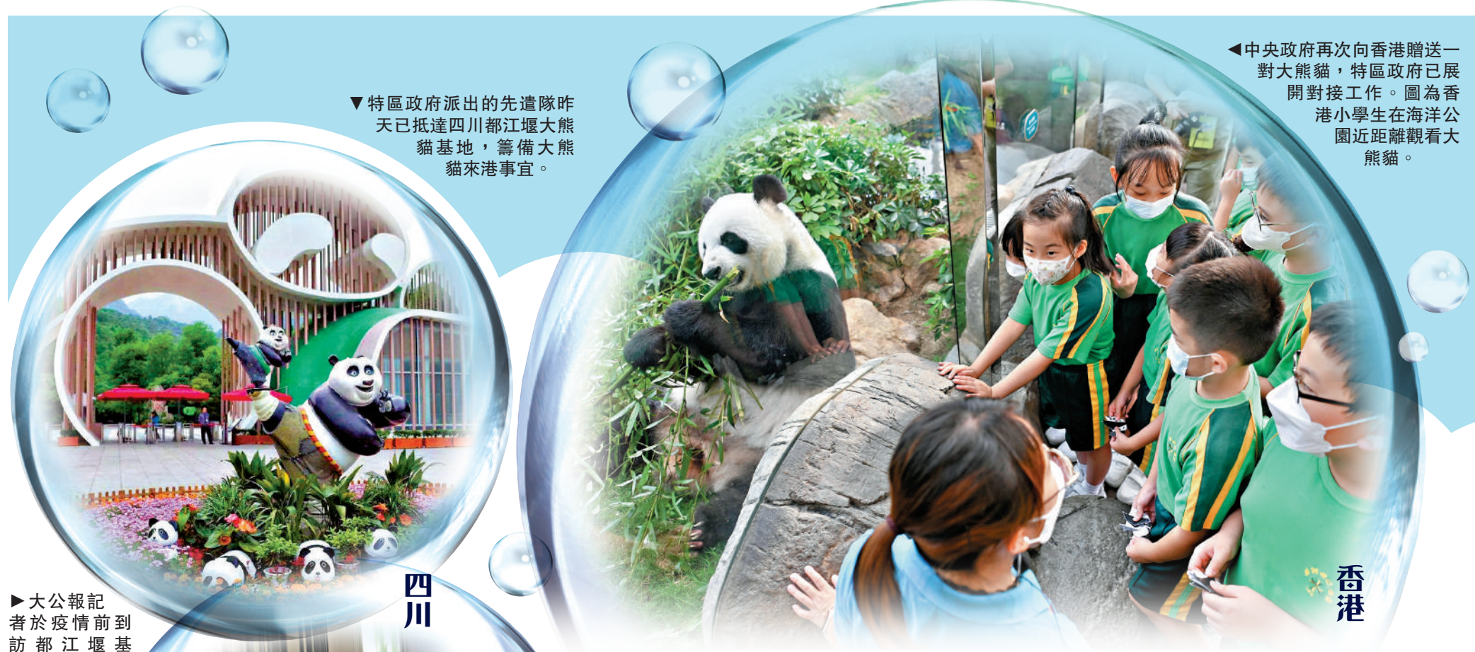
▼特區政府派出的先遣隊昨天已抵達四川都江堰大熊貓基地，籌備大熊貓來港事宜。