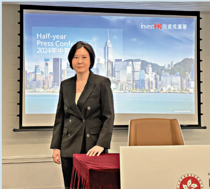
▲瑞士大型私募基金集團 Partners Group 看好香港優勢，上月正式來港開設辦公室。