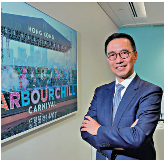
▲文體旅局局長楊潤雄表示，香港旅遊業正在轉型，未來會更上層樓。