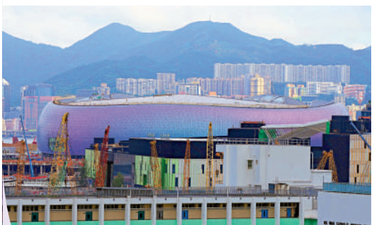
▲啟德體育園是本港歷來最大的體育設施。

啟德體育園將於明年上半年啟用，文化體育及旅遊局局長楊潤雄表示，啟德體育園工程進度良好，符合預期，預計今年底完工，並在明年