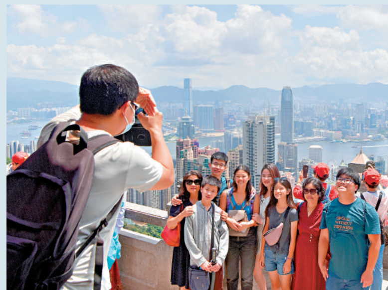
▲太平山頂等傳統旅遊熱點，展現香港特色，吸引力不減。

行政長官李家超在去年施政報告提出制訂《香港旅遊業發展藍圖2.0》，制訂相應的未來工作計劃、具體行動、措施和績效指標，進一步拉動不同產業共同推動本港旅遊業發展。政府早前就《藍圖2.0》諮詢業界，楊潤雄日前接受《大公報》訪問時表示，旅遊業受疫情影響很大，加上整體航運力未完全恢復、旅客旅遊模式轉變等，本港旅遊業正面對新的環境及挑戰，《藍圖2.0》是在2017年公布的《香港旅遊業發展藍圖》基礎上，思考怎樣令本港的旅遊業做得更好。