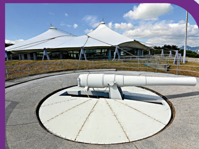
▲香港海防博物館將改設為香港抗戰及海防博物館，9月初開幕。

楊潤雄表示，雖然《文藝創意產業發展藍圖》未出台，但政府近年投入推動文藝創意產業發展的資源越來越多，並漸見成效。他提到，新一份財政預算案分別向「電影發展基金」及「創意智優計劃」注資約14億元及29億元，支持電影、藝術、設計等不同範疇的項目，近年本港有不少廣受歡迎的電影，流行文化節的節目亦備受歡迎。