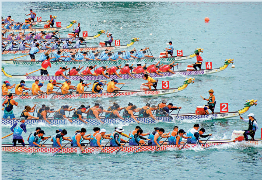
▲龍舟邀請賽是香港傳統文化盛事，特區政府致力推動。