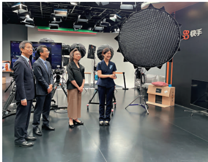
▲楊何蓓茵（右二）及公務員事務局常任秘書長梁卓文（左一）昨日下午到快手總部的演播中心參觀。

楊何蓓茵今日將到北京大學政府管理學院，出席特區政府與北京大學為特區高級公務員合辦的公共管理碩士課程的首屆學員畢業典禮，並會與第一期畢業生和正在北大學習的特區公務員等會面交流。