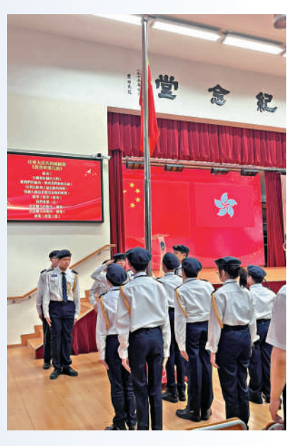
▲新會商會陳白沙紀念中學國民教育日，舉行升旗儀式。

在網絡安全資訊素養主題分享環節，中四的簡朗同、孫銘澤同學講述自己先後來到大公文匯集團參觀及體驗拍攝新聞影片的經歷，探討新聞工作者如何甄別和傳播真實信息。孫同學向大公報記者表示：「平常都只是看看報紙，完全不知