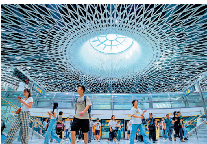
張曉晶指出，香港同外部接軌的同時，也要加強大灣區內部聯動，增強發展動力。圖為深圳崗廈北地鐵樞紐。

除了與國際和內地融合外，如何做好差異化競爭對香港的下一步發展至關重要。「提升競爭力就是要做不一樣的東西。」張曉晶表示，伴隨上海國際大都市功能定位的確立以及「五個中心」建設的逐步落實，香港應該充分利用特區「特」的優勢，在普通法體系下充分發揮資本自由流動的力量，借助法律和政策的傾斜來實現差異化競爭。此外，還要同新加坡進行差異化競爭，在金融科技、虛擬資產、數字資產這些新興領域中保持發展態勢並加快發展進程，建立獨特的領先優勢，進一步提升香港的競爭力。