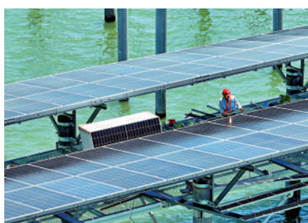
綠色金融發展前景可觀。圖為福建東山縣的海上光伏電站。新華社