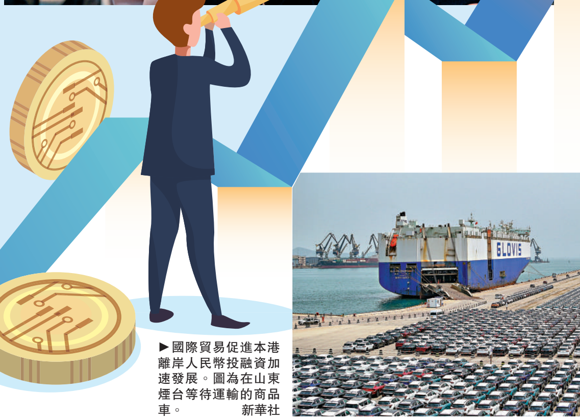
國際貿易促進本港離岸人民幣投資加速發展。圖為在煙台等待運輸的商品車。