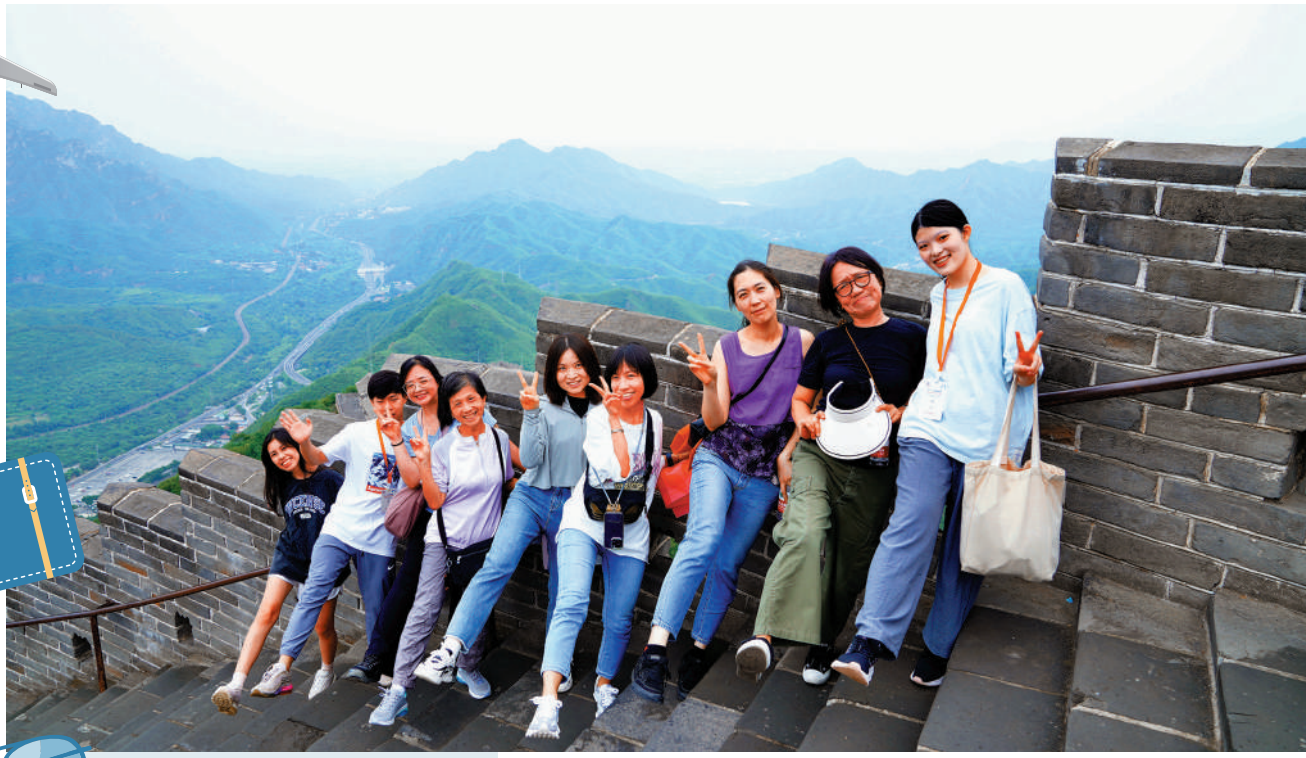
雖然民進黨當局發布所謂赴大陸的旅遊警示，但仍有不少台灣民眾如常赴大陸旅遊。圖為台灣青年2日遊覽北京居庸關長城。

【大公報訊】據台媒報導：台當局陸委會副主委梁文傑日前在記者會上表示，近期大陸發布《關於依法懲治「台獨」頑固分子分裂國家、煽動分裂國家犯罪的意見》，台灣當局認為有必要自6月27日起提升赴大陸以及港澳旅遊警示為「橙色」，建議台灣民眾非必要宜避免進入陸港澳。