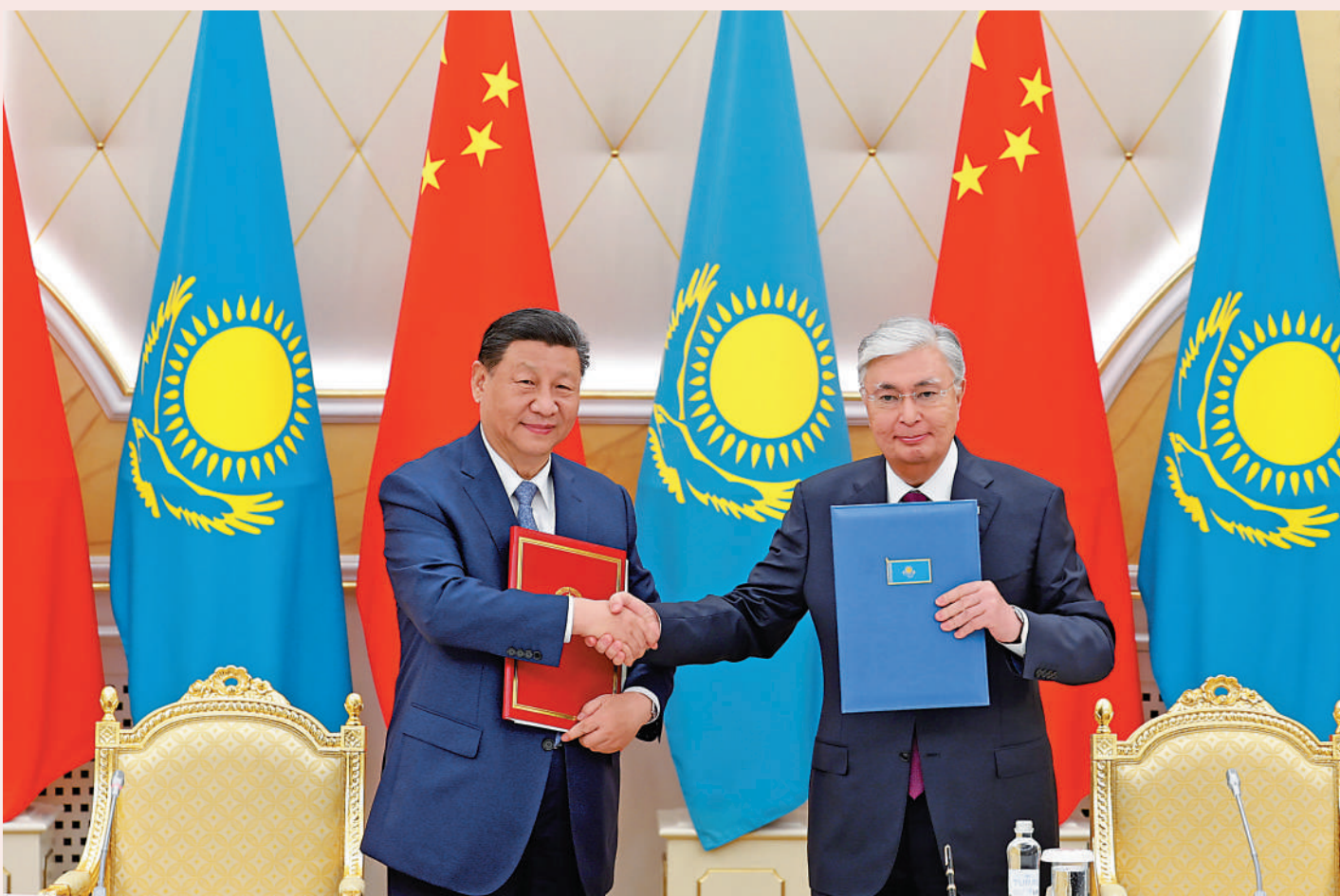
▲當地時間7月3日上午，中國國家主席習近平在阿斯塔納總統府同哈薩克斯坦總統托卡耶夫舉行會談。會談後，兩國元首共同簽署《中華人民共和國和哈薩克斯坦共和國聯合聲明》，並共同見證交換經貿、互通互聯、航空航天、教育、媒體等領域數十項雙邊合作文件。中新社

【大公報訊】據新華社報道：習近平乘車抵達總統府時，托卡耶夫總統熱情迎接。托卡耶夫為習近平舉行隆重歡迎儀式。兩國元首登上檢閱台，軍樂團奏中哈兩國國歌。習近平在托卡耶夫陪同下檢閱儀仗隊。