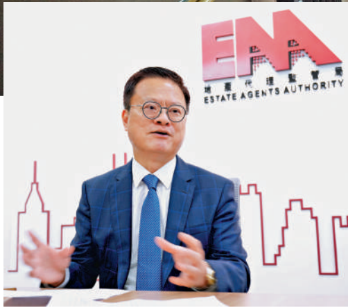
▲地監局主席蕭澤宇表示，自割房租管條例實施以來，共接獲16宗投訴。