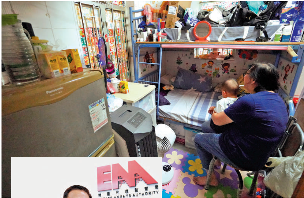
▲割房租管條例自2022年起生效，訂明租期、租金、租住權保障等規定保障租戶。