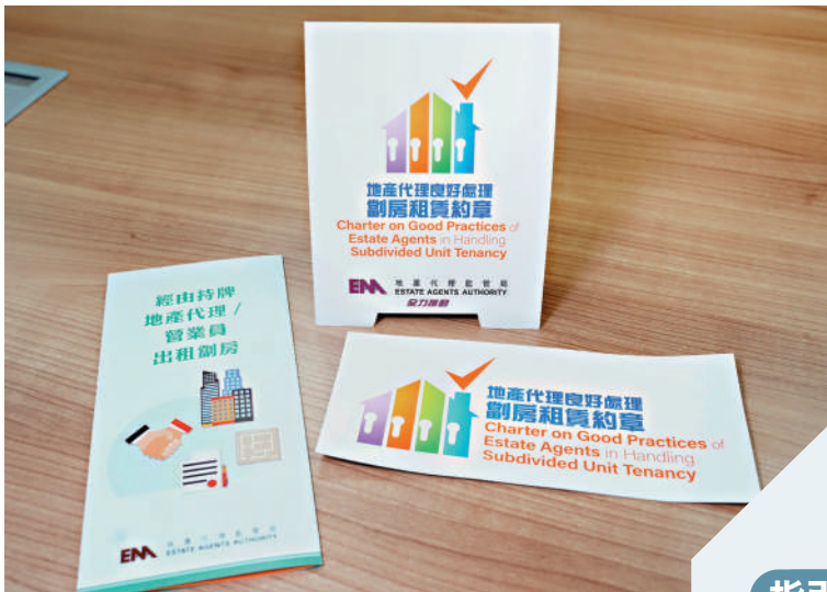
地監局推出《地產代理良好處理割房租賃約章》，鼓勵業界遵從條例要求。

政府成立的「解決割房問題」工作組，正計劃為割房設定最低標準。蕭澤宇表示，當最低標準公布後，如有牽涉到地產代理，地監局會適時作出指引或去信提醒業界。