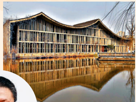
中國建築師王澐以現代建築方式，重新演繹中國文化。圖為中國美院象山校区，就是王澐作品之一。

他認為香港新一代建築師的水平有提高，因為眼界和品味都有提高，因此建築風格是「靚」，新的建築大致是「幾好樣」，但普遍是在西方建築套模下的「靚仔」，欠缺本地文化精神。