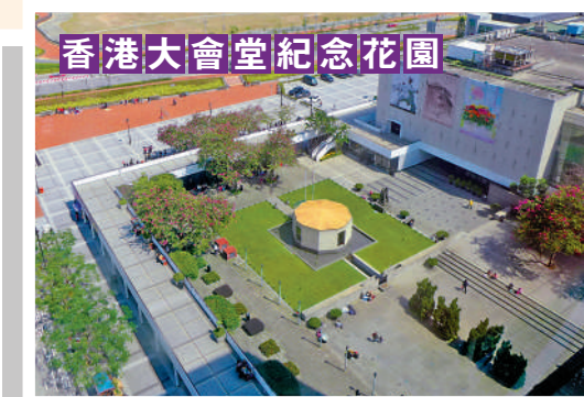
香港大會堂紀念花園